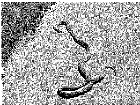
アオダイショウ 2020年5月31日 12:44 えりも町字庶野広域林道えりも線