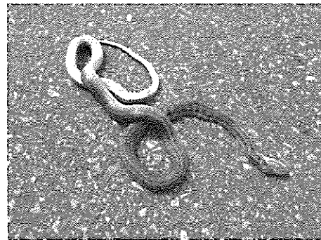
シマヘビ 2021年8月5日 12:56 えりも町字庶野広域林道えりも線