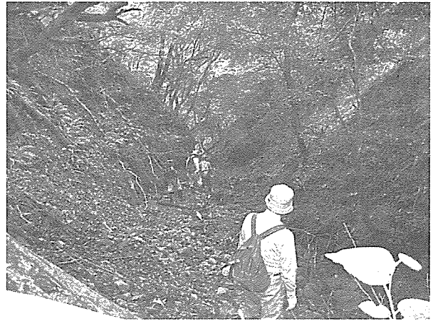
様似山道、幌満近くの沢を下る。

様似山道について、榎本は「路は険しくない」としているが、馬に乗って通行したようだ。道中最後の方でやれやれやと下ると思った時に「下り路に悪い石路がある」とあり馬でも難儀したようである。