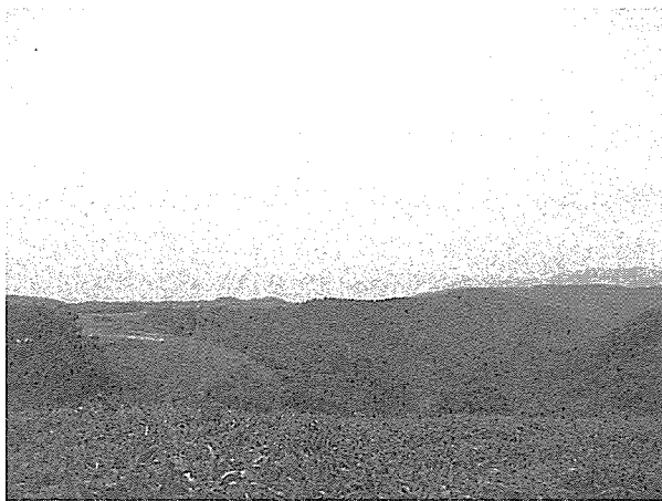
猿留山道からも襟裳岬、百人浜を一望できる。

腫れて熱を持ち、蜂の獐猛さを身を以って知ることとなった。また、筐の中には小さなダニも棲息しており、筐漕ぎ（筐をこぐようにかき分け歩くこと、筆者注）の後は目に見えない小さなダニが飛んでたかるといふことで、主催者が用意してくれたガムテープで服についたダニを取り除く作業も行った。またこの日、百人浜の海を見おろす広大な草原をシカ2頭が大きな跳躍をしてあつという間に駆け去ったさまに出会うなどは、異次元の世界に居ようであった。毎年シカの角を拾うイベントも開かれ、大勢の参加者で賑わうそうである。