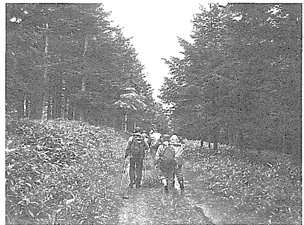
猿留山道(一部林道になっている)を歩く。

翌19日は猿留山道に入る。今回の事業の主目的である山道復元整備に便乗しての山歩き、写真を撮るなどして最後尾を続け皆のお荷物となったが、この道を独りで歩くのは非常に困難である。山道は今もヒグマの生息地でシカ、キタキツネなどの多くの野生動物が住む危険な場所である。今回もヒグマ対策として鈴を鳴らしながら大勢で歩いた。