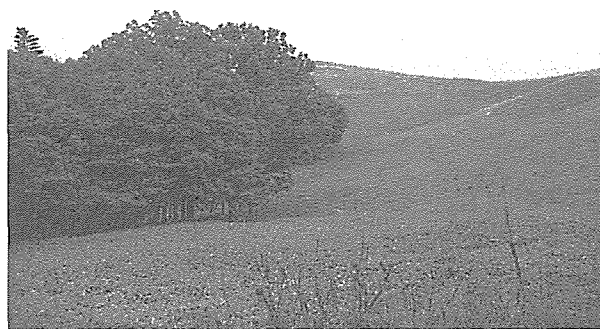
猿留山道は町有牧野と日高山脈の山塊の間を通る。

「水利にも恵まれ、好き放牧場ともなり、立派な村落になるであろう」との予測通り、町営の牧野になっている。