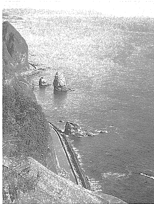
様似山道からえりも方面を望む

が無くなっている。岩の角の上を伝って通る…怒濤を避けて波が引くのを待ってまた次の出た岩の先をまわり…」と描写している(注2)。またこの日記には、海岸線を難儀して通行する様子を生き生きと描いた附図が添えられている。(注3)