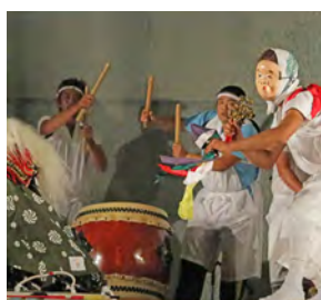
文化財無形指定町えりも「襟裳神楽」