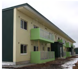
整備が進む公営住宅

また、個人住宅については、「住宅改修等助成補助事業」を引き続き実施し支援を行っていきます。