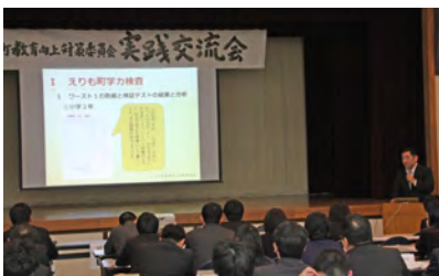
教育向上対策委員会実践交流会

27年度は、次の7点、①学力向上に係る学校改善プランの策定と全国学力・学習状況調査とえりも町学力調査結果を踏まえた具体的な取組、②4つの方策（学習規律の最低基準の徹底、板書と整合したノート指導、定着の段階を位置付けた指導過程、積極的な他校との研修交流）の授業改善の徹底・継続、③道教委指定「学校力向上事業」を柱とした小・中学校一体と