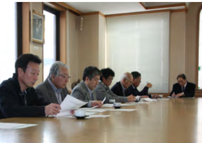
国民健康保険運営協議会（3月3日開催）