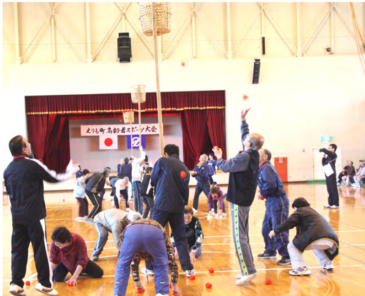
玉入れ競技は30秒間で入れた個数を競い、本町チームが1位

1種目めの「ビリヤード」は、ラクビーボールをゲートボールのスティックで転がしながら15メートルの地点で折り返し、次の走者にリレーしていきます。普段、ゲートボールのスティックを使い慣れていないという参加者も「ラクビーボールがどこに転がっていくのかわからなくて難しい」と苦戦していました。