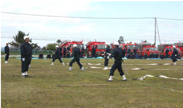
気温が低い中、きびきびと訓練に励む消防団員 家族が見守る姿も見られました