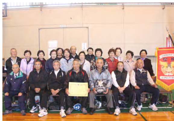
えりも岬チームは3年連続の優勝を果たしました

3種目めの「あなたといつまでも」は新種目の競技。2人1組が腰にミニバレーボールを挟みながら走ってリレーをし、最終走者はスタート地点に戻ってきてから、手をつないでゴールまで走ります。肩を組み合わせながら、ボールを落とさないようにと息のあった走りが必要なので、各チームの団結力が深まりました。