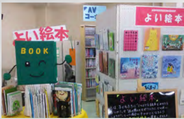
図書室マスコットキャラクターブック BOOKくん