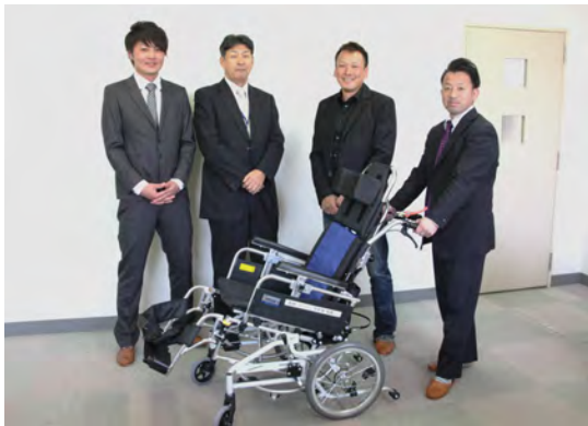
岩間会長(右から2人め)は「社会福祉の向上に少しでも役立てて欲しい」と津国施設長(左から2人め)に車いすを手渡しました