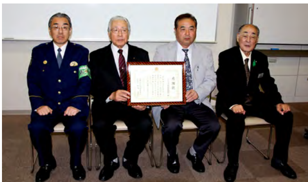
植田署長(左端)から感謝状を受け取った大高会長(左から2人め)総会の役員改選で任命された金澤会長(右から2人め)