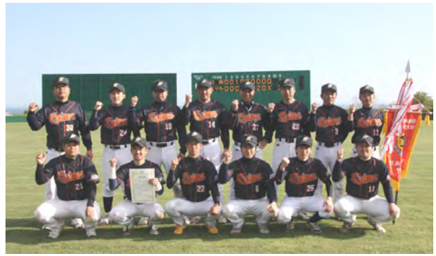
9月に釧路市で行われる全道大会の出場権を獲得しました

第49回全道自治体職員等野球選手権全道優勝大会日高予選大会が浦河町潮見ヶ丘公園野球場で開催されました。この大会に管内から8チームが出場し、トーナメント戦で5月16日、17日の2日間行われました。決勝はえりも町職と日高町職が対戦し、えりも町職が1点リードされて迎えた7回裏の攻撃で、レフトオーバーのツーベースヒットを放ち逆転。2対1でえりも町職が優勝しました。