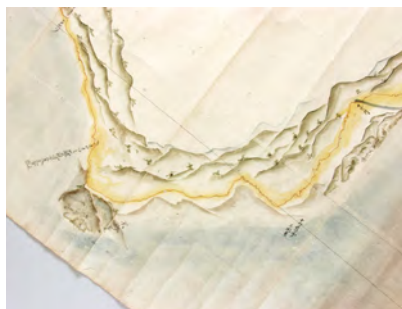
写真・伊能忠敬・松前藩蝦夷行程 測量分図(三石～ピロオ)より

9月2日・3日開催される「伊能忠敬 大図フロア展」に展示される「伊能忠敬 大図フロア展」を、えりも町民体育館で開催します。ご期待ください！（主催・北海道農業土木測量設計協会）