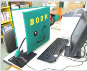
図書室マスコットキャラクター BOOK(ブック)くん

〒福社センター図書室 ☎2526 E-Mail: erimolib@seagreen.ocn.ne.jp