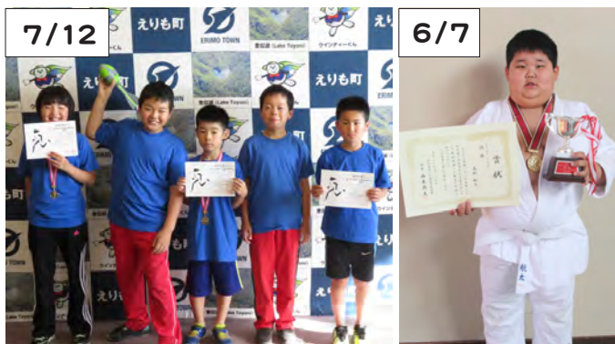
えりもTFCの5人の選手