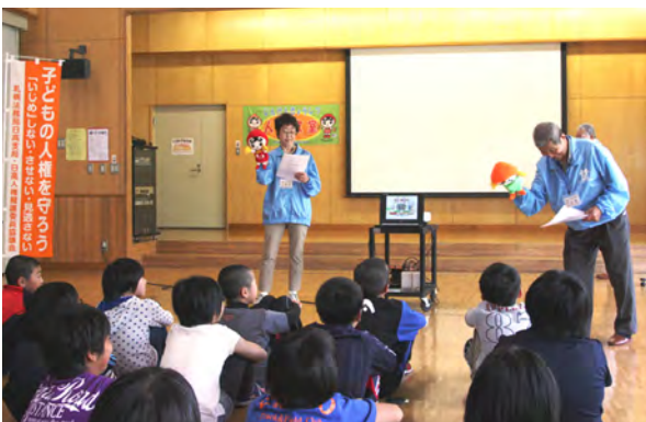
人権の大切さを人形を使って演じる人権擁護委員