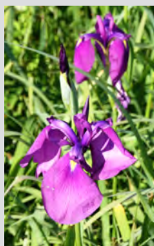
悲恋沼湖畔に咲く ノハナショウブ 7月9日撮影