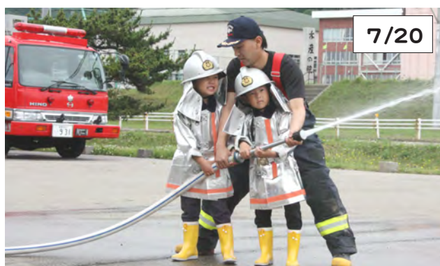
火点的的を狙って放水する園児と補助する消防職員

日高東部消防組合えりも支署は、幼年消防クラブに所属している光の園幼稚園の園児26人を招いて、放水体験を実施しました。消防職員や女性消防団員に補助されながら、園児は2人1組で放水体験。勢いよく出る水に驚きながらも楽しそうでした。消防車や救急車の試乗体験も行い、最後に消防車の前でウインディーくんと記念撮影をしました。