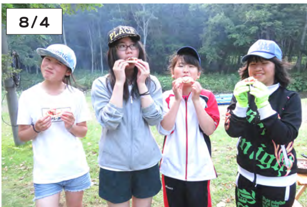
自分たちでつくったピザを食べる参加者の児童