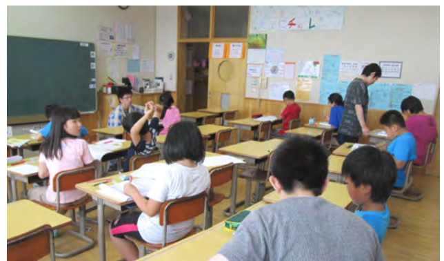
小学生にやさしく勉強を教える高校生ボランティア

えりも小学校の夏休み学習会が7月26日から8月4日までの間、学年ごとに日にちと時間がそれぞれ設定されて行われました。学習会の日程のうち3日間、高校生ボランティア10人が参加し、学習補助につきました。8月2日の学習会は、高校生ボランティア5人が参加。高校生は児童の机を巡回し、丁寧に勉強を教えていました。