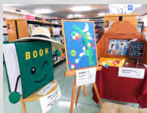
図書室マスコットキャラクター BOOK(ブック)くん