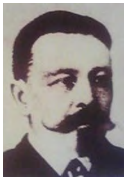
写真・ルイス・ベーマー