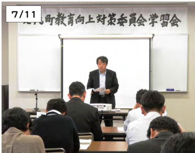
学習講座を行う鶴居小学校の工藤教頭