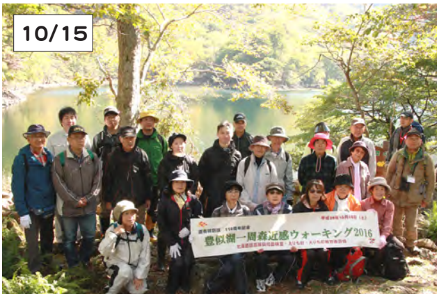
豊似湖一周した後に参加者で記念撮影