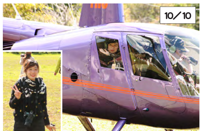
最終日に遊覧飛行を楽しんだ香港からの観光客

9月17日から始まった遊覧飛行の利用者総数は64組の106人で、昨年の92人を上回りました。そのうち町民割引の利用者は11組15人、今年から始まった豊似湖と襟裳岬まで遊覧飛行する飛行時間20分のコースには、3組6人の利用者がありました。