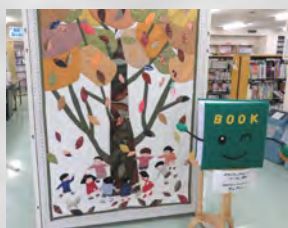
図書室マスコットキャラクター BOOK(ブック)くん