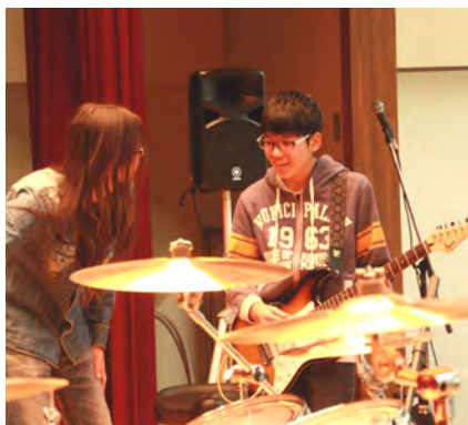
ワークショップでギター技術指導を受ける軽音同好会の高校生⑤⑥