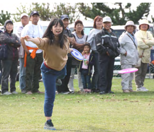
相手は、たも網で受けるフリスビーキャッチ