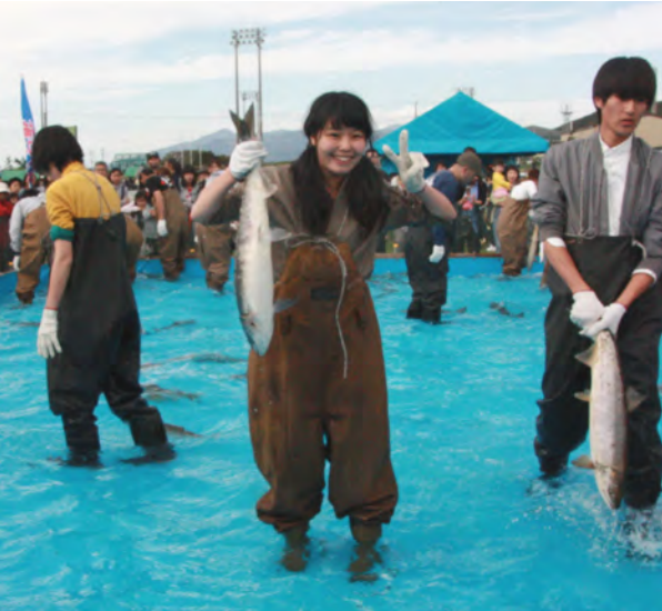
サケをつかまえて笑顔の参加者