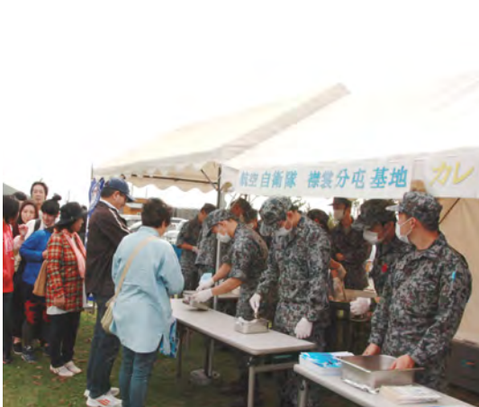
航空自衛隊襟裳分屯基地はカレーうどんを無料提供した