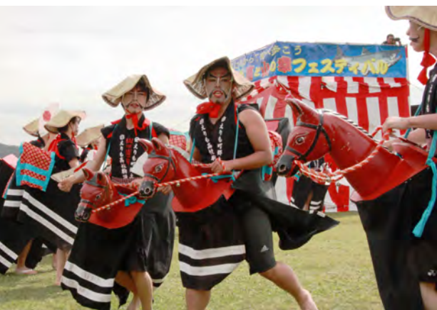
駒踊りを披露するえりも高1年生