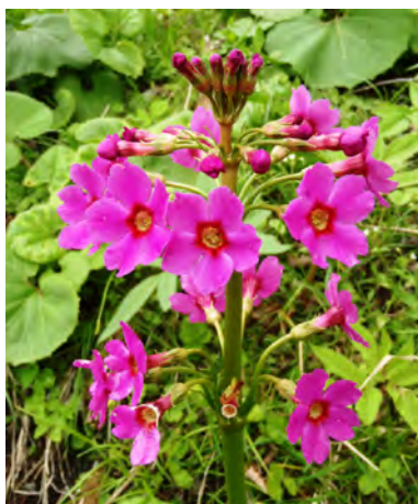
【写真】春に咲くクリンソウ

青い花が咲くかわいらしい草木植物、たぶんオカトラノオ属と思われる草もしばしば見かけました。そして美しいクリンソウが渓流のかたわらに生えていました。野生のものを見るのはこれが初めてです。この植物は4年前にイギリスに紹介され、習性が優雅なのでたちまち諸外国に広まり、野外で育てる草花の中でも、もっとも愛される種類のひとつになりました。