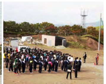
中学校裏山にある水源地横の坂を登り、避難場所までの経路を確認しながら移動する生徒や地域住民