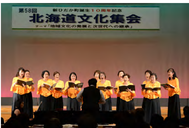
表彰式後、アートステージで合唱を披露

賞の3団体・1個人の中に選ばれました。しお風コーラスは、老人ホーム慰問等の活動を継続し、昨年は30周年の記念演奏会を開催しています。表彰式後のアートステージで、組曲「えりもに咲く」と「森の贈り物」を合唱し、日ごろの活動の成果を披露しました。