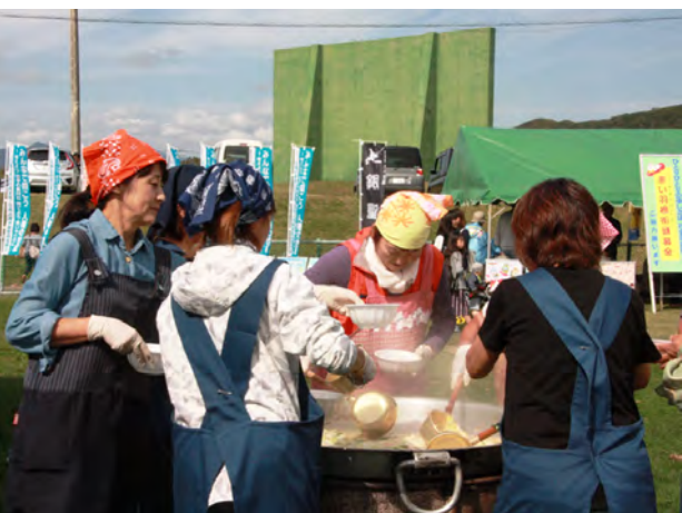
サケ鍋を無料提供した漁協女性部