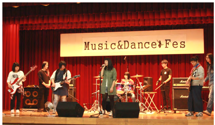
高校軽音同好会「Popcorn」のワークショップの様子