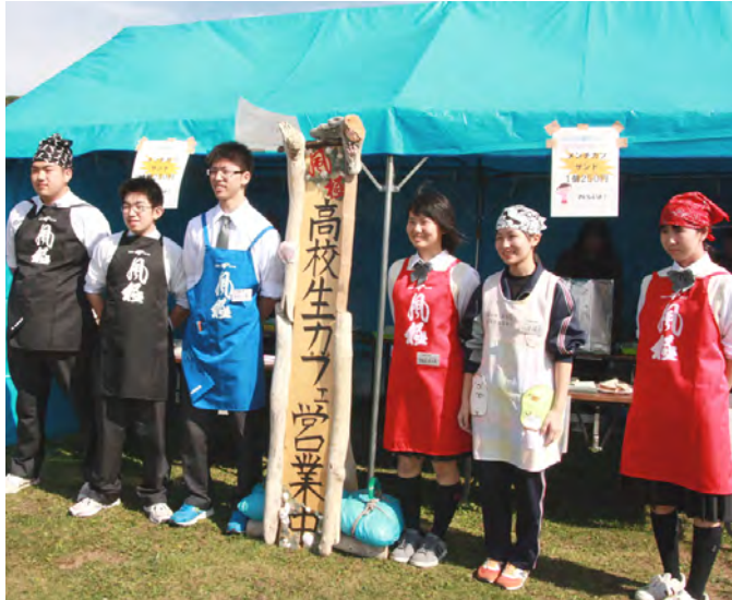
えりも高風極プロジェクト同好会の「高校生かふえ」