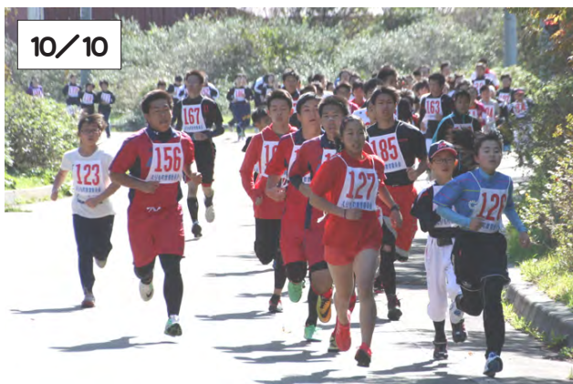
マラソンコースを力走する参加者