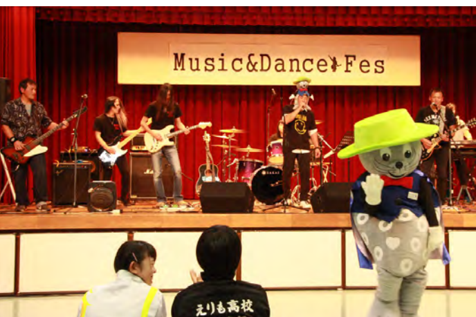
「MEDIAS ZONE」と「シルバーモンキーNEO」の 合同ステージ