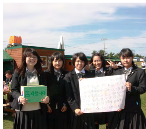
ナザレ園への募金活動をするえりも高3年生

「第35回えりも海と山の幸フェスティバル」が10月2日、スポーツ公園を会場に開催されました。町内外から訪れた約9500人はえりもものを満喫しました。 毎年大人気、中学生以上が参加できる「サケのつかみどり大会」の参加資格を獲得するために、抽選券を求め、700人以上の行列ができました。 ツブ串や焼きイカ、サケ鍋やイクラ井などの海の幸のほかに、えりも産の肉やミニトマト、キノコ汁などの山の幸が販売され、出店前にも行列ができていました。 えりも高は、1年生が郷土芸能の