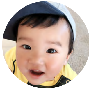
わきざか たける 脇坂 壮くん