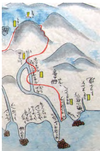
写真：罕有日記(函館市中央図書館蔵)を拡大

先月の続き、安政四年(一八五七)、の記録「罕有日記(かんゆうにつき)」猿留から幌泉へ向かう旅。 10月7日(旧暦八月二十日)サルル 7時過ぎ出発。番屋からすぐに草や樹木の中を行き160m位でサルル(二里標ヒタタヌンケより5.8km、幌泉へ29.4km)川を左に見て500m位行くと、ようやく繁った林の中を登る。 小川を越え、また坂道を降り降りして、ヨン子ナイ川(幅は18m位)石のある川で清流である。渡って山中は平坦で雑木の中500m位にてノホリサル、川(川幅は36m位)、石のある川で、急流なのは前の川と同じ。渡ってなお山林や川があり、越えて