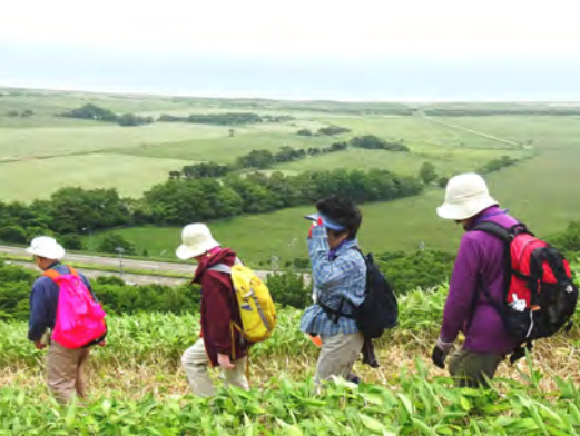
眼下に広がる百人浜と襟裳岬の景色を楽しみながら歩くBコースの参加者