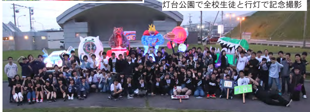
灯台公園で全校生徒と行灯で記念撮影

など、生徒たちが考案したメニューが提供されました。今年のクラス対抗パフォーマンスは体育館で実施し、ブレイクダンスやミュージカル風のダンスなどで、審査員の町長や教育長たちにアピールしました。