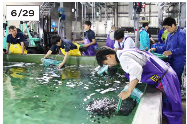
搬入したマツカワの稚魚を飼育水槽に移す関係者

伊達市の道栽培漁業センターから、えりもセンターへのマツカワの稚魚搬入が6月29日から始まり、7月6日と10日の全3回、各15万尾ずつを計45万尾搬入しました。マツカワの資源回復を目指し、毎年行われています。町や漁協職員らが輸送水槽から飼育水槽へ手早く移し替え、30mm以上に成長した稚魚の引っ越しが終了。この後、えりもセンターで中間育成し、9月頃放流されます。