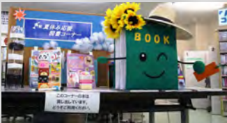
図書室マスコットキャラクター BOOK(ブック)くん