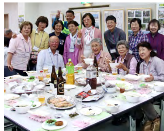
参加者と実行委員会でなごやかに交流

交流会は町の各団体や企業の方々の協力で、国史跡指定記念お祝いのお赤飯や青マス汁、マツブの刺身や時サケなど、えりもならではの食事を参加者に味わってもらい、交流を深めていきました。アトラクションでは郷土芸能の「えりも駒踊り」「アイヌ式舞踊のツルの舞」「襟裳神楽」が披露され、発表ごとに盛大な拍手が送られました。