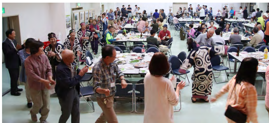
えりもアイヌ協会古式舞踊部会によるリムセ(輪踊り)にみんなで参加しました