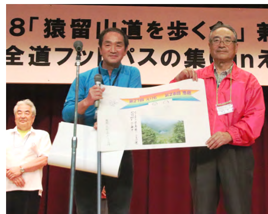
えりもの新松会長(右)から恵庭の前田会長(中)へ。全道フットパス引き継ぎ式