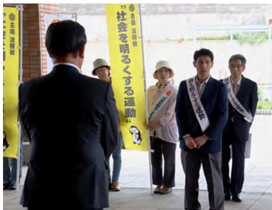
出発式で決意表明をする大坂分区分長

5台の車両に浦河更生保護女性会えりも支部、人権擁護委員ら12人が乗り込み、パトカーを先導に役場前を出発。町内一円をパレードし、犯罪や非行のない安心・安全な地域社会を目指す啓発活動を行いました。