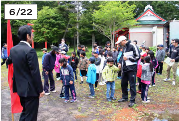
庶野小から避難路を通して高台に避難した児童