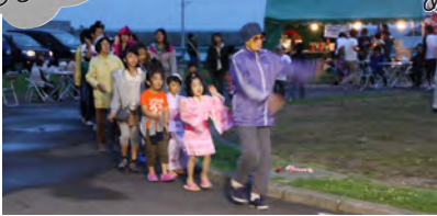
親子盆踊り会と子どもお楽しみ会