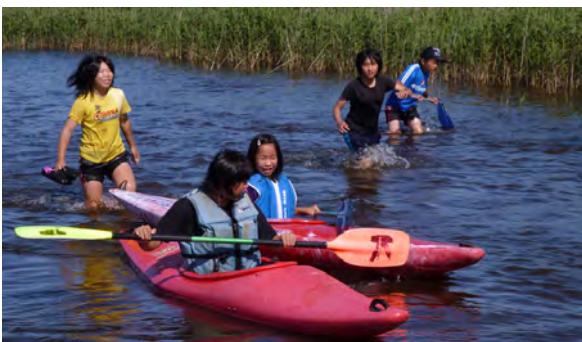
カヤックや魚捕りを楽しむ子どもたち

郷土資料館が自然に楽しんでもらおうと企画したもので、乗り慣れないカヤックに最初はおっかなびっくりだった子どもたちも次第に慣れ、見事なパドルさばきを見せていました。また、子どもたちは魚捕りにも挑戦していました。