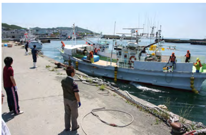
救援物資を積み、えりも港に戻ってきた船舶