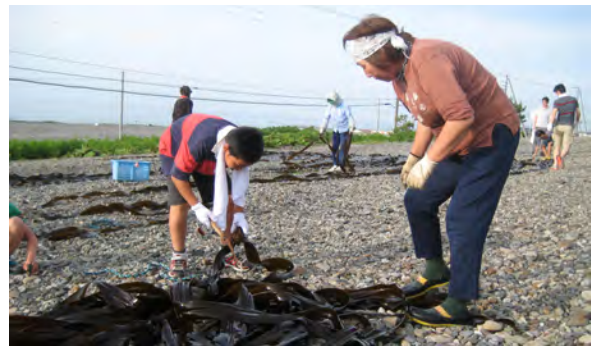
コンブのカブタ切りを教わる参加者の子ども