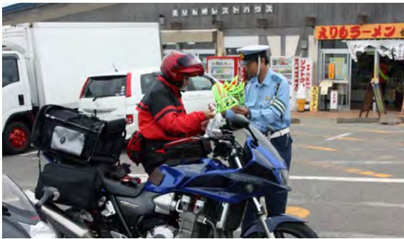
三角旗を受け取るバイクで訪れた観光客

八月三日、日高地区交通安全推進協議会が中心となり、バイクで襟裳岬に訪れた観光客に向けて、交通安全啓発運動を行いました。八月十九日の「バイクの日」にちなんだもので、参加した町交通安全関係者ら八名は、一人一人に事故防止を呼びかけながら、「ストップ交通事故死」と書かれた三角旗などを渡しました。