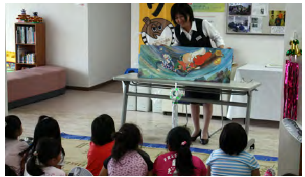
熱心に聞き入る子どもたち