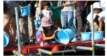
小学校の鼓笛隊パレードとマツカワの放流（上から）。