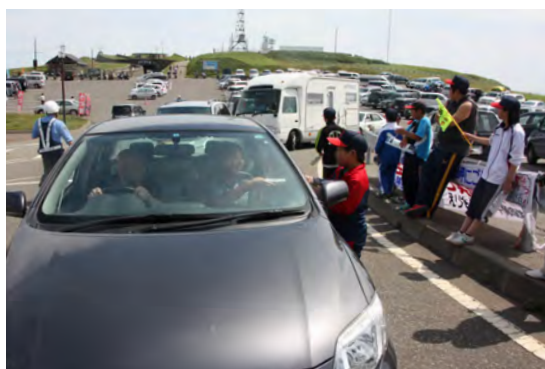
観光客に安全運転を呼びかける子どもたち

※2 後納保険料を納付できる期間は、平成24年10月1日から平成27年9月30日までの3年間です。