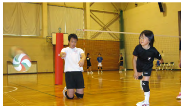
身振り手振りを交えて熱心に教える男子部員