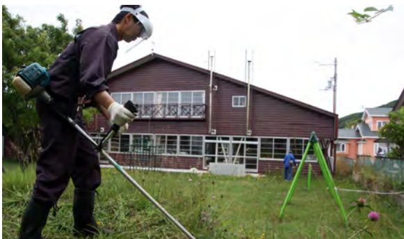
光の園幼稚園の広場の草刈りを行うメンバー