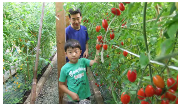
家族連れが多く訪れていました。