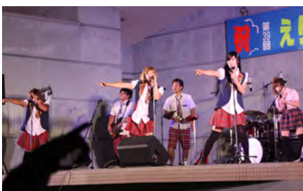
15日最後を飾った轟T D S 48ライブ