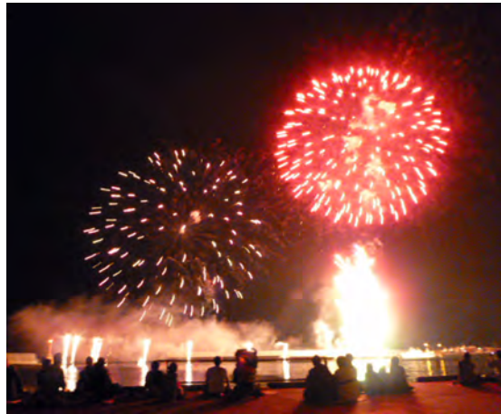
天気にも恵まれ、大輪の花を咲かせた今年の花火。