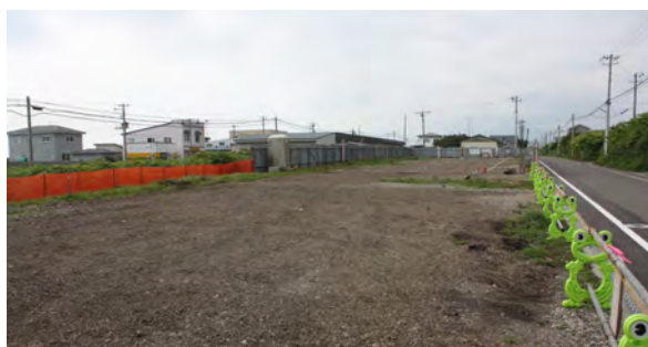
大和C団地の建設予定地

一般会計予算が、シカ買上金などで二千七百万円補正され、歳入歳出それぞれ四十四億三千六百万円となりました。