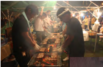
勇駒会の駒踊り、男の子は射的に挑戦、人出の多さに出店はフル活動（上から）。