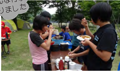
わらしやんどキャンプ