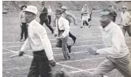
第1回高齢者スポーツ大会の様子

6月には、本町にはじめての交通信号機が国道西川石油店横の十字路に設置されました。7月に