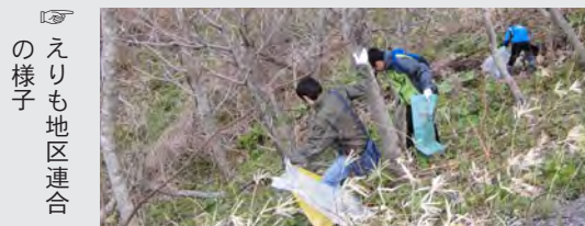
えりも地区連合の様子