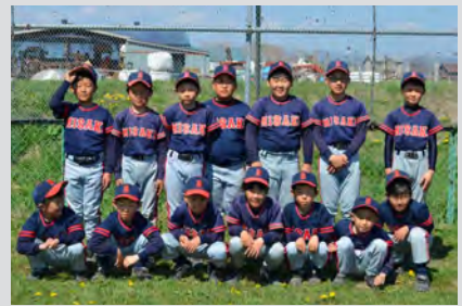
えりも岬野球少年団

この日は、小学生の参加者22名のほか、えりも中学校とえりも高等学校のボランティア15名も加わり事業をサポート。歩いた後は、参加者が里山で採取した山菜を天ぷらにして試食会を行いました。