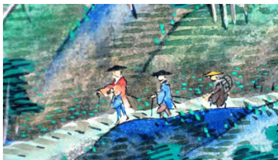
（北海道歴検図を拡大）