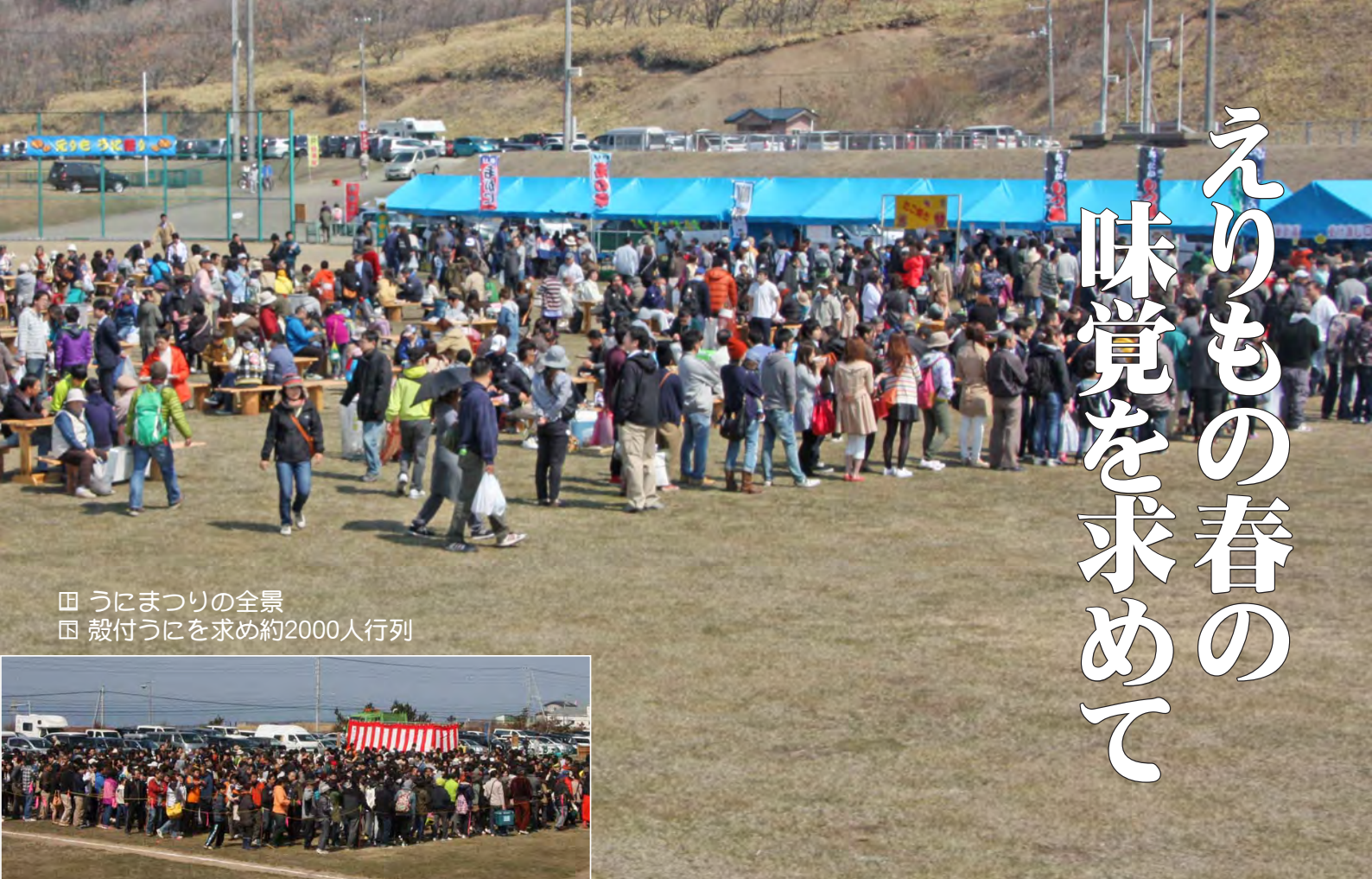
田 うにまつりの全景 田 殻付うにを求め約2000人行列