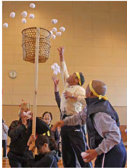
優勝したえりも岬老人クラブ。 年齢を感じない、見事な動きです。

5月19日、町民体育館で第42回高齢者スポーツ大会を開催し、町内8地区の老人クラブから選手204名が参加しました。 大会は新種目の玉入れや定番のボーリングなどを含む8種目で競い、総合得点で順位を決定します。