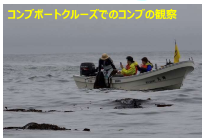
コンブボートクルーズでのコンブの観察