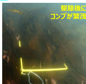
駆除後に コンブが繁茂