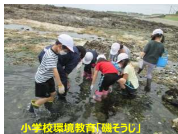
小学校環境教育「磯そうじ」