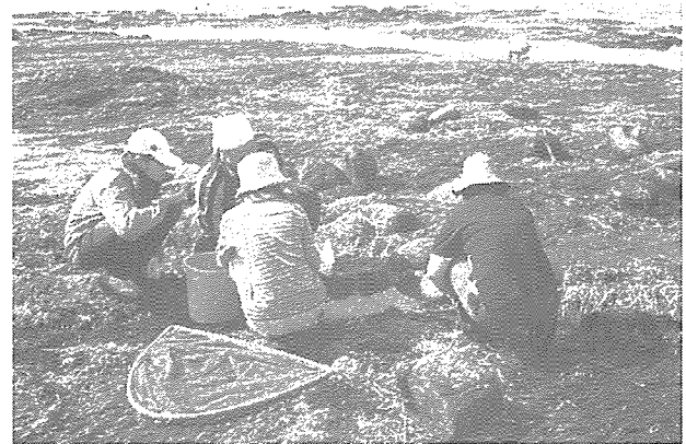
図2. えりも港湾南側平磯

分布する種がに付着していた原因として、港湾内では潮流がゆるやかで、係留ロープは陸と船をつなぐためある程度の長さや重さがあり、干満に関係なく常時水没していることが多いと考えられた。