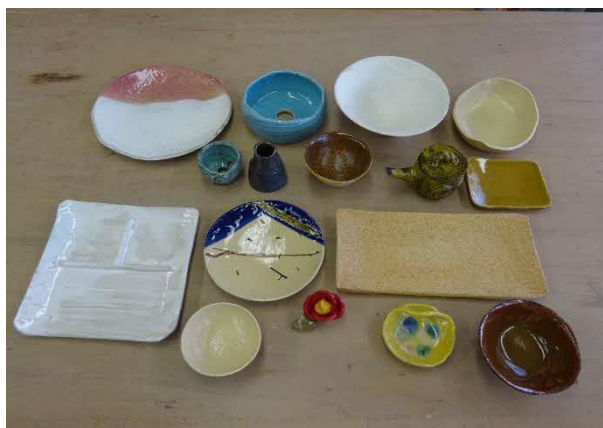
昨年10月に行った「体験陶芸教室」の作品です。

その他：新型コロナウイルス感染拡大防止の対策(3つの密をさける、マスク着用、消毒)をお願いします。参加対象は、えりも町民のみとさせていただきます。