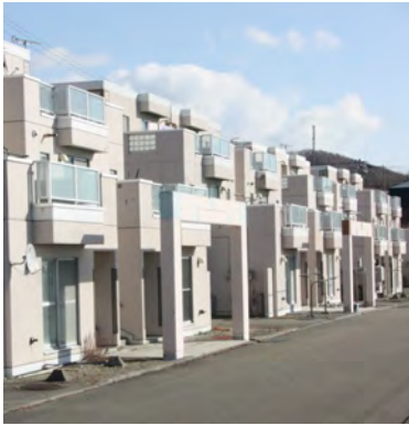
※写真と募集住宅とは関係ありません