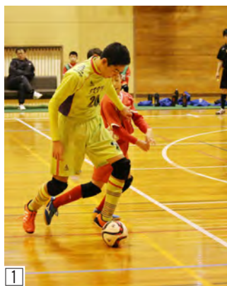
①相手の厳しいマークを受ける選手②懸命にボールを追いかける選手たち