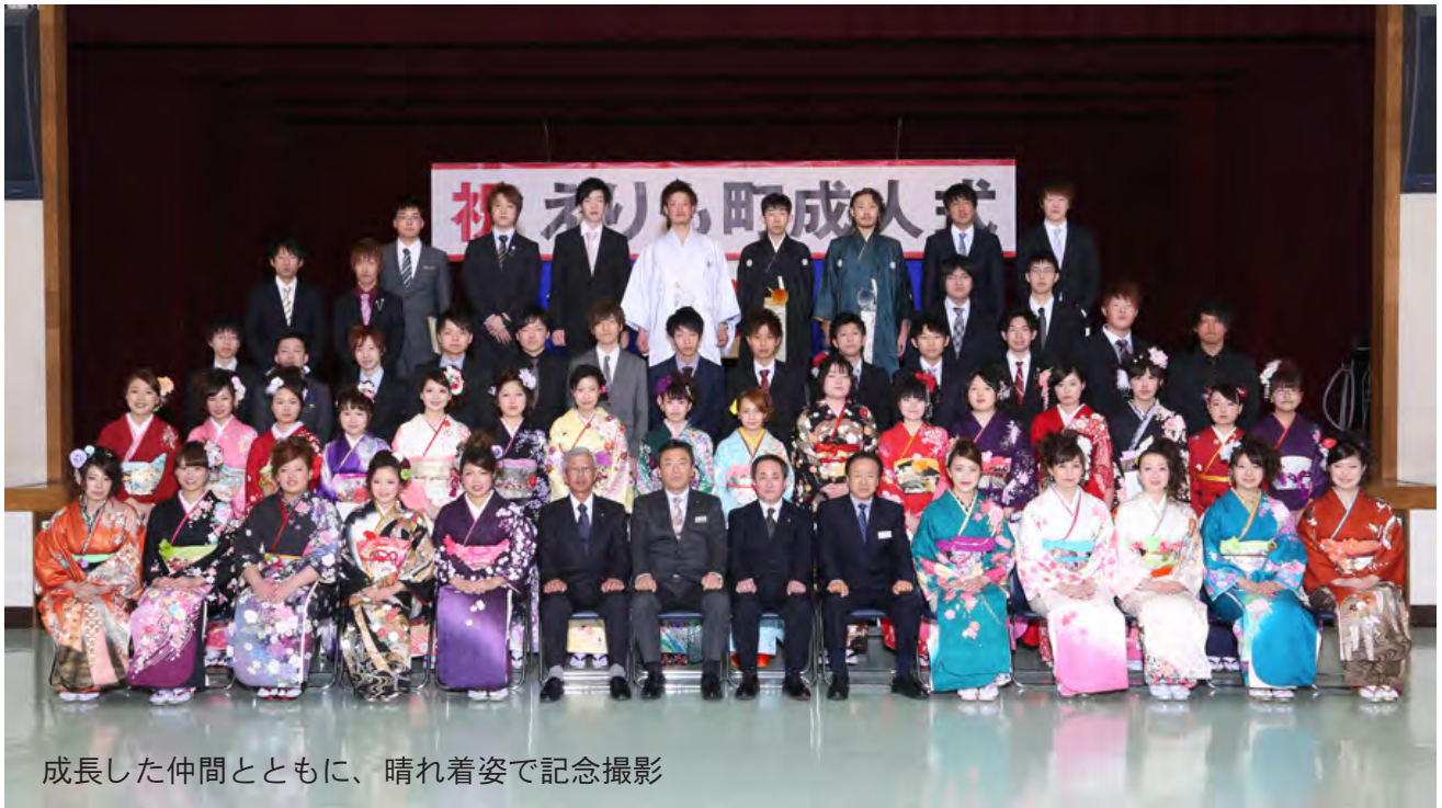
成長した仲間とともに、晴れ着姿で記念撮影