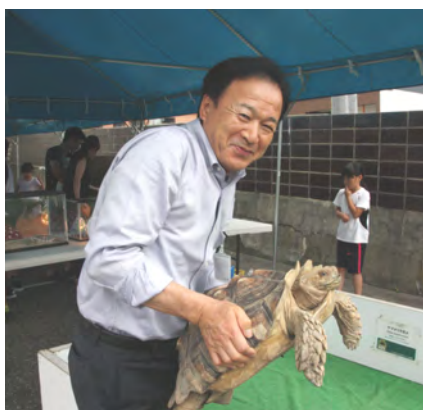
ミニ動物ふれあい会

市街地区や東洋、岬地区において、幼児児童が待ちに待っていた「盆踊り会」が、夏休み期間中に地区青少年健全育成会の主催で開催されました。また、近笛地区においても、漁協青年部が主催して盆踊りが開催されました。当日は、地域の方々と幼児児童などが和やかに親し