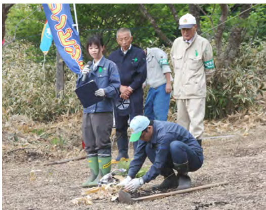
えりもワクワク森林づくり体験事業植樹祭

当日は、えりも漁業協同組合女性部、えりも岬小学校と東洋小学校の3年生以上の児童、航空自衛隊襟裳分屯基地隊員をはじめ、北海道森林管理局古久保局長、一般財団法人セブニーイレブン記念財団関係者など町内外合わせて220人の参加により、トドマツ200本とハンノキ400本の苗木を植樹いたしました。「緑化事業」をさらに実り多いものとするため、今後も「緑の大切さ」をひとりでも多くの町民に呼びかけ、豊かな森林づくりを推進してまいります。