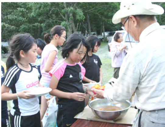
わらしやんど・えりもまるごと自然体験

また、ハートの湖、豊似湖の観覧会を5月から4回実施しており、故郷の自然を知り、保全について学ぶ機会となりました。