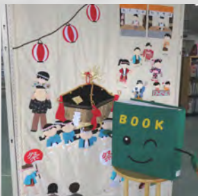
図書室マスコット キャラクター BOOK(ブック)くん