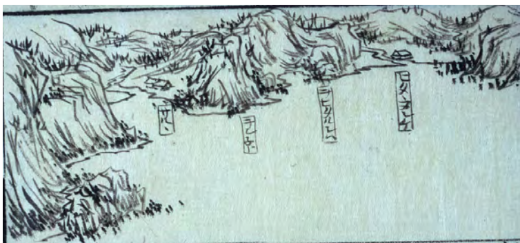
上の図は、境浜（ビタタヌンケ）と目黒（サルル）

10月25日（新暦）サルルの番屋に着く。この番屋はホロイズミの場所であるが、エリモ岬から当所までの昆布を十勝より採りに来ているために、この番屋の宿取扱いは十勝が管理していたので、十勝番人が来て世話をしていた。 （略）冬、山中が雪で道を通れない時、今も海岸を通る。通行屋一棟、板蔵一棟、雇いアイヌ小屋一棟あり、昔ここにはアイヌ小屋五棟あったが、今は一棟もない。前に標柱がある（十勝より五里二十八丁、幌泉より六里二十四丁五十四間）。この辺