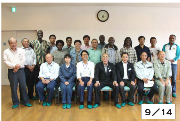
研修視察団(後列)と、地域関係者、日高南部森林管理署の職員、海外林業コンサルタント協会参与、研修監理員