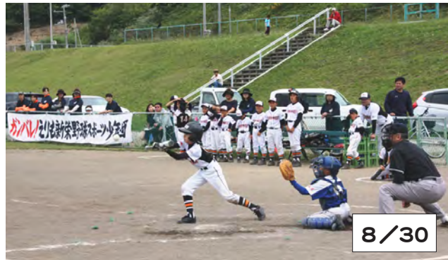
準優勝したえりも新栄野球スポーツ少年団の攻撃

決勝で、えりも新栄野球スポーツ少年団は荻伏野球スポーツ少年団と対決し、父兄達の声援の中、健闘しましたが、2-4で惜しくも敗れ、準優勝でした。