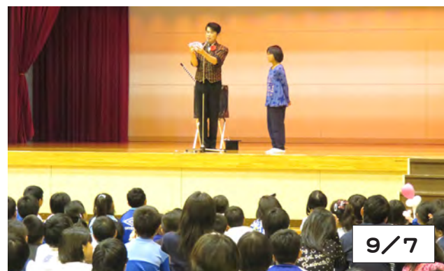
「太田ひろしマジックショー」にステージ参加する児童

9月7日、教育委員会は小学生と保護者を対象に、芸術文化鑑賞会を町民体育館で開催しました。観客は「大道芸人ミスターきくちジャグリングショー」や「太田ひろしマジックショー」の世界にひきこまれていました。途中、児童のステージ参加もあり、バルーンアートをプレゼントされたり、マジックを体験。目の前で起こる不思議な出来事に、歓声や拍手が沸いていました。