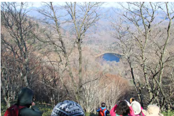
猿留山道沼見峠から豊似湖を望む

トヨイ 険しい山をしばらく歩いて、南に険しくそびえたっている間に一つの沼があり、これをトヨイ（豊似湖）という。深い沼である。その上の小道から見るととても美しく見える。 この上の山をトヨイノホリ（豊似岳）という。神霊がいて、昔、この山にアイヌがシカを負った時には、激しくはなはだしく雨が降り、よって早々と帰ってきたという。 少々行き峠有、トウブチ峠ま