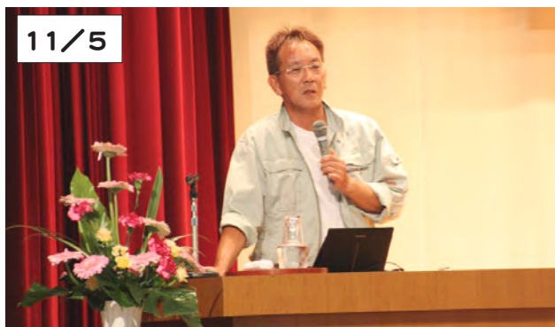
講演をする旭山動物園の坂東園長