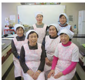
食生活改善推進員協議会の会員

今年度の「おやこの食育教室」は、2月を予定しています。お母さんだけでなく、お父さんの参加も大歓迎です。メニューもお楽しみに！