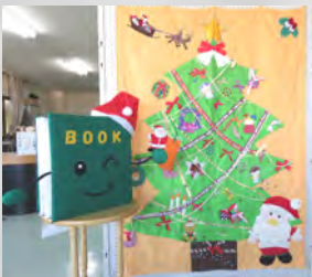
図書室マスコットキャラクタ-BOOK(ブック)くん

〒 福祉センター図書室 ☎2526 E-Mail : erimolib@seagreen.ocn.ne.jp