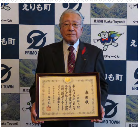
多年にわたり役職員を務めた功績が認められ、このたびの受賞となりました