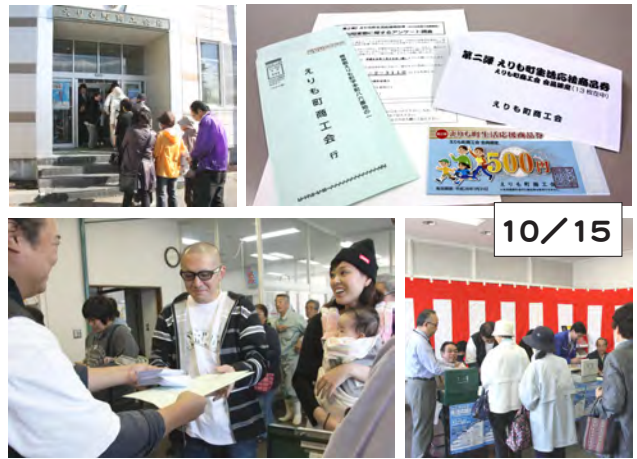
販売会場の商工会の外にも行列ができました

商店街では、生活応援商品券を利用のお客様に、商品券1枚につきボックスティッシュを1箱プレゼントするなど、町内で買い物を楽しんでもらうために、工夫を凝らしている店舗もありました。