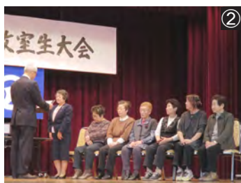
①目黒老人クラブの作品。福祉センターロビーには各老人クラブの絵画や工作などの作品が展示された②町老人クラブ連合会会長表彰を受賞した7名