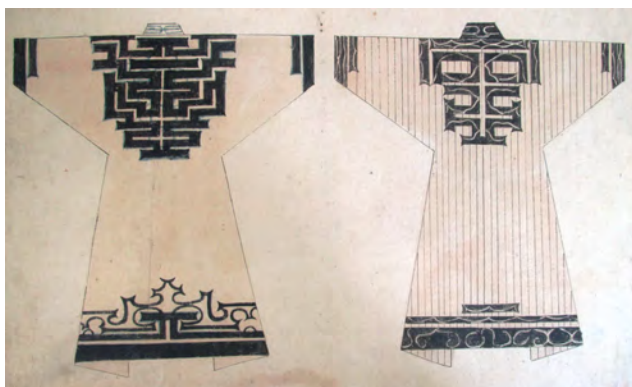
図・アツシ織りの衣装(えりも町文化財「蝦夷一覧」より)

山の中腹を南へまわり、左にえりも岬等を望む、少し行くとパンケシトマヘツ シトマヘツ ペンケシトマベツ 三か所とも谷川、地名シトマヘツは風雪厳しく歩きにくいところ。少し行つて アブチ ここから百人浜を眺めるに良い。昼休所一棟(十七坪半)この辺水がなくシトマベツから運ぶ。地名アブチ(アフツ)はア ンツの訛り言葉である。古く