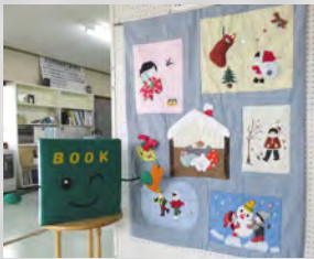
図書室マスコットキャラクタ-BOOK(ブック)くん

〒 福祉センター図書室 ☎2526 E-Mail : erimolib@seagreen.ocn.ne.jp