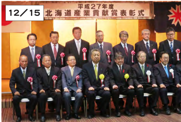
道産業貢献賞表彰式に出席した丸山さん(前列左から2人目)