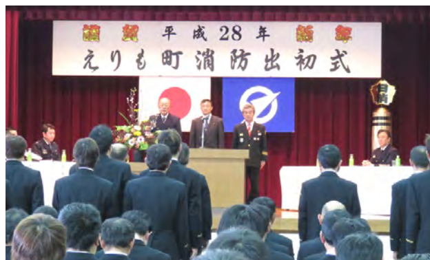
屋内式典では、永年勤続功労章や優良章などで団員46人が表彰されました