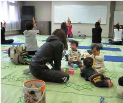
ママのヨガ中、お子さんたちも楽しく遊んでいます