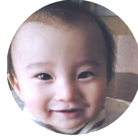
たしるるき 田代 壘侏くん