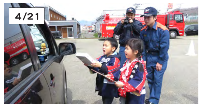
中央保育所の園児（年長組）はドライバーに元気に「火の用心をお願いします」防火を呼びかけました

春の全道火災予防運動期間中、幼年消防クラブの中央保育所園児18人は、日高消防組合えりも支署庁舎前で、国道を走行するドライバーに防火チラシと応急手当セットを手渡し、火災予防を呼びかけました。配布用の品は、危険物安全協会えりも支部から提供されたものです。配布後、消防車に体験試乗した園児たちは、歓声をあげていました。