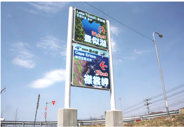
新設された町内観光案内看板

過疎化が進行する中であって、本町の合計特殊出生率は、道内トップの水準にあります。この要因のひとつとして「漁業を中心とした産業基