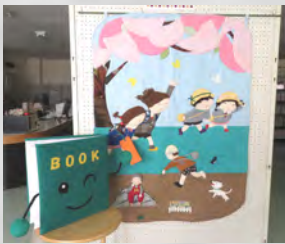
図書室マスコットキャラクター BOOK(ブック)くん

〒福社センター図書室 ☎②2526 E-Mail : erimolib@seagreen.ocn.ne.jp