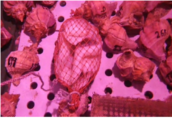
マツブ（エゾボラ）の生態研究と調査