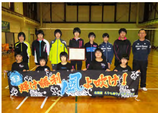
えりも岬ウインディーズバレーボール少年団

えりも岬ウインディーズバレーボール少年団は、第13回北海道スポーツ少年団バレーボール交流大会で優勝したことが評価され、受賞となりました。