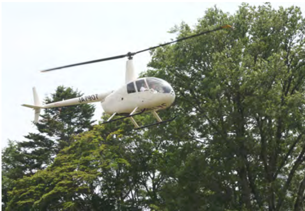
豊似湖ヘリコプター遊覧飛行