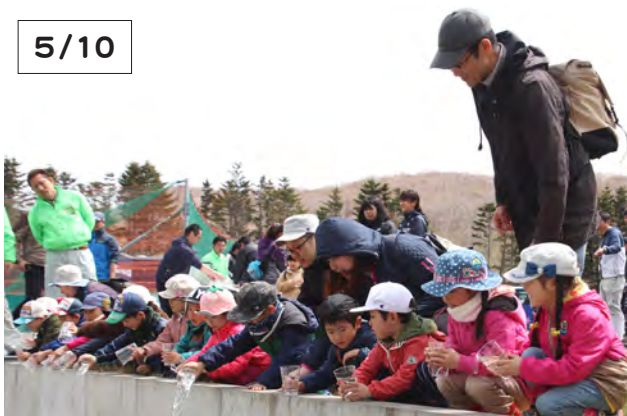
サケ稚魚を放流する園児たち