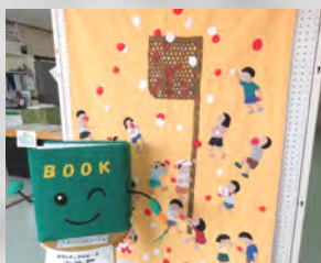
図書室マスコットキャラクター BOOK(ブック)くん