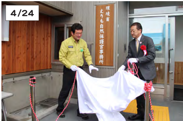
除幕式を行う平野自然保護官(左)と泉副町長(右)