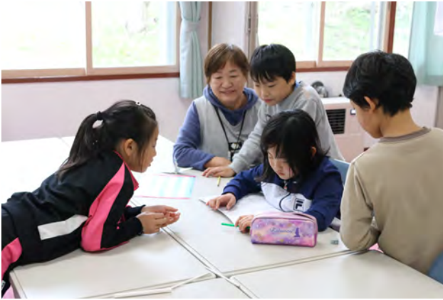
庶野放課後児童クラブで宿題に取り組む児童たち