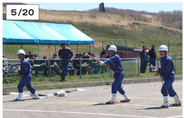
真剣な表情で訓練に取り組む消防団員

町消防団の消防訓練大会がスポーツ公園で開催され、7分団の団員120人と、7台の消防車両が集まり、日ごろの訓練の成果を披露しました。分団ごとに小隊訓練、ポンプ車操法訓練などを行い、最後の訓練は、えりも小校舎より火災が発生したことを想定し、分団車両7台がスポーツ公園から校舎前へ出動。消防車のサイレンの合図で7人の消防団員が一斉に放水し、訓練を終えました。