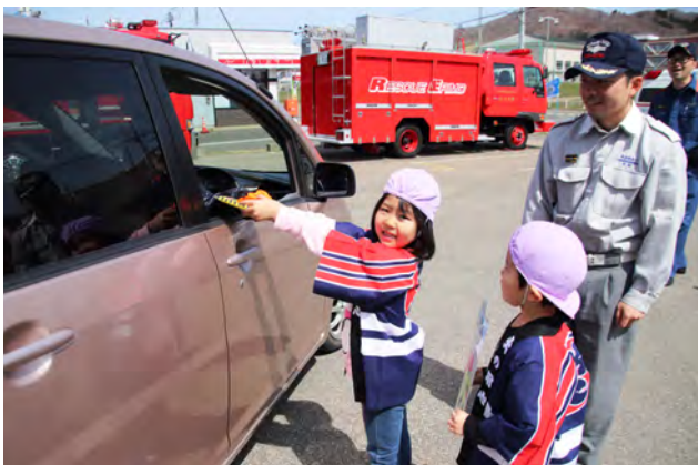
ドライバーに火の用心を呼びかける園児たち