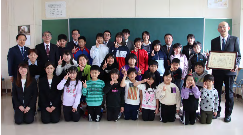
教育実践表彰を受けたえりも岬小の児童と教職員