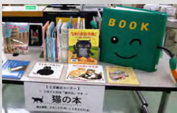
図書室マスコットキャラクター BOOK(ブック)くん