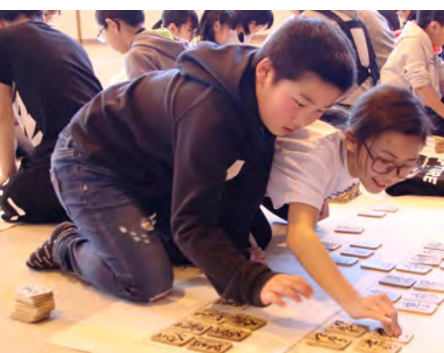
熱戦を繰り広げた百人一首