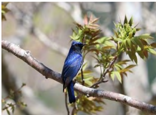
【写真：オオルリ (オス)】

オスは沢筋の梢(こずえ)にいくつかのソングポスト(さえずり場所)を持ち、それらを巡りながら盛んにさえずります。 谷沿いの森にある岩場や崖にコケをたくさん用いて営巣します。外敵が巣に接近するとメスもさえずることがあり、また、雌雄でさえずりを交わす行動も稀に観察されます。 町内の沢沿いの森林でも、その姿を観察することができます。木の高