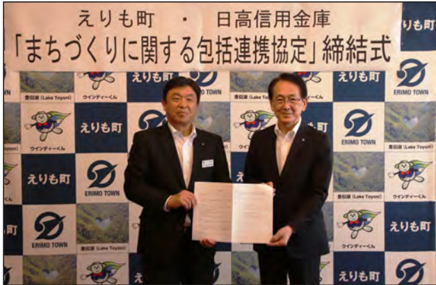
協定書を交換する大西町長(左)と大沼理事長(右)