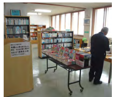
再開した図書室 返却時等の消毒を徹底

6月1日からはすべての施設が利用可能となったことから、当面は三つの密（密集・密接・密閉）を避けて運営してまいります。