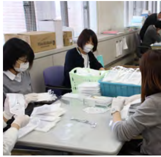
マスク配付準備作業

が、5月に入っても感染拡大とマスクの流通状況は好転することなく、国からのマスクも遅れている状況にありましたので、19歳から64歳の町民に対しても不織布マスクを一人5枚配布することとし、必要量を確保するのに時間を要しましたが、5月26日、郵送により配布を終えたところです。