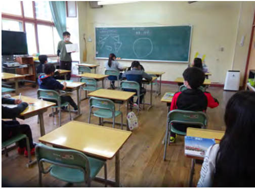
分散登校の様子（庶野小）

進めてまいりました。 5月18日からは、複式学級を有する笛舞小、東洋小、えりも岬小、庶野小の各校は、奇数学年と偶数学年が交互に登校し、単式学級のえりも小は、1週間に2学年ずつ3日間、3学年ずつ2日間の登校となりました。 また、えりも中は毎日1学年ずつの登校とし、えりも高は5月25日から全学年午前授業、午後は個別講習を進め、6月1日からは、小・中・高の全校が正常授業の学校再開となっております。 運動会や修学旅行などの学校行事については、今学期は実施を見合わせましたが、2学期以降に時期や内容も含めて検討してまいります。