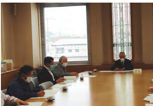
△国民健康保険運営協議会の様子

続いて令和2年度国民健康保険の税率改定について説明があり、原案のとおり承認され、国保事業の運営に関して意見が交わされました。