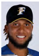
ブライアン・ロドリゲス 選手