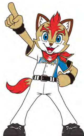
【ファイターズマスコット】 フレップ