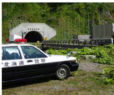
5月22日に実施されたパトライト作戦

このことについては、「緊急メッセージ」で町民の皆様にお伝えをしたところですが、今後は、浦河警察署をはじめとする関係機関・団体等との連携を強化し、交通事故の撲滅に努めてまいりますので、町民の皆様には、より一層、交通安全運動に対するご尽力を賜りますようお願いいたします。