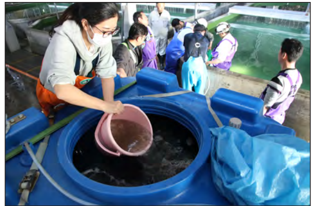
輸送用水槽へ稚魚を移す作業