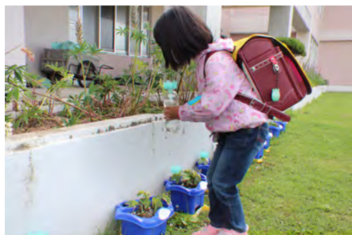
1年生は、アサガオを育てており、毎朝自分の鉢植えへお水をあげています。