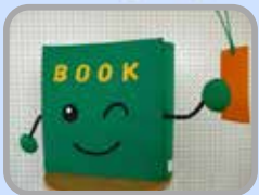
図書室マスコットキャラクター BOOK (ブック) くん