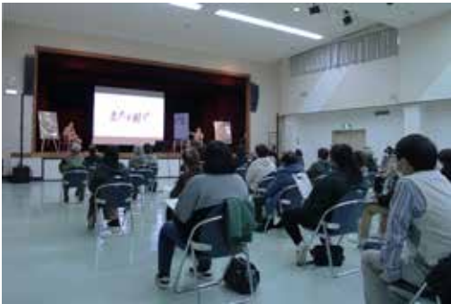
ステージ上では、主人公洪沢栄一と北海道の関係性や、最新の撮影技術についてなどが話されました