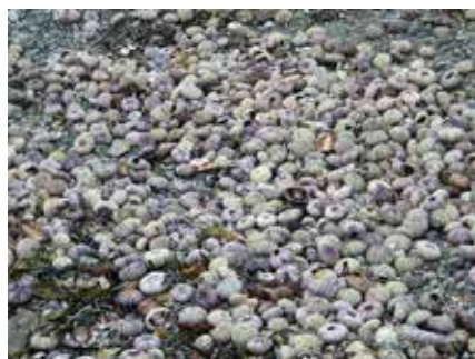
庶野地区の海岸に打ち上げられた大量のウニ

9月20日以降、町内において、定置網内でのサケのへい死やウニの大量へい死、マツブやタコの不漁など、赤潮の影響と思われる被害が発生しています。