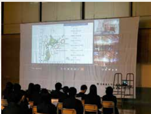
えりも高校防災教育講演の様子