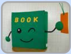
図書室マスコットキャラクター BOOK (ブック) くん