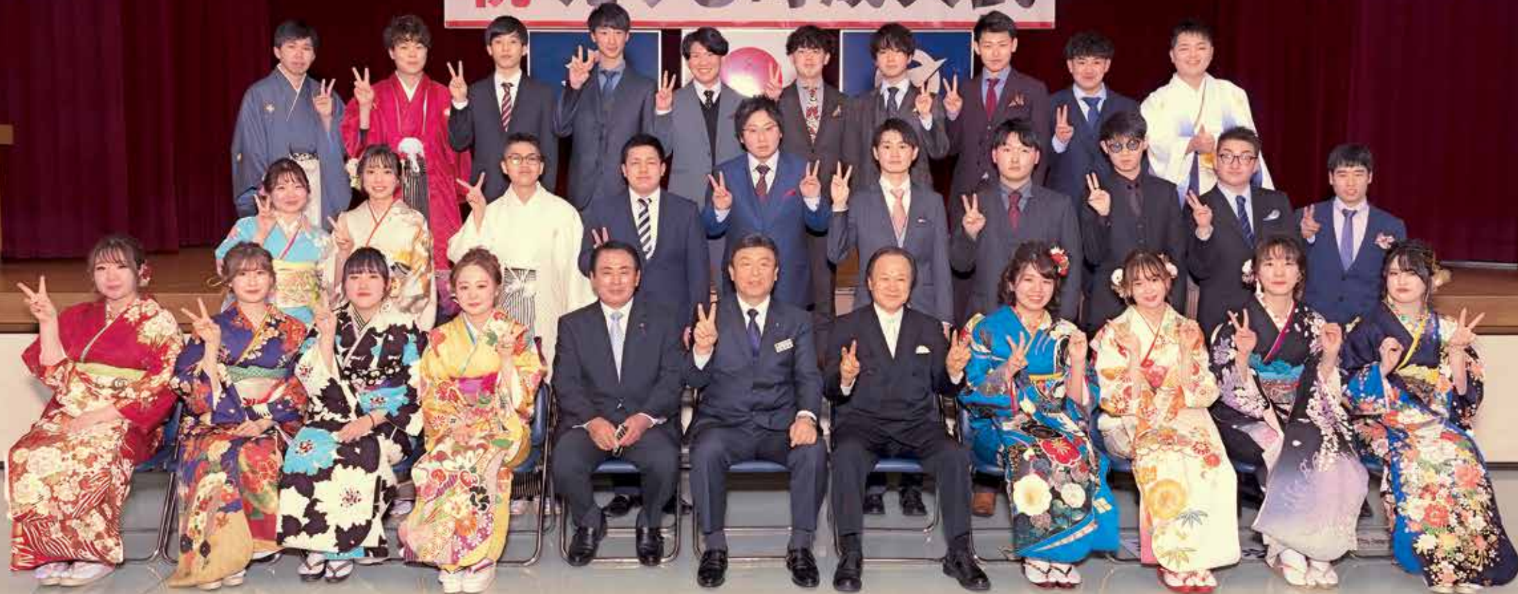
令和4年えりも町成人式(福祉センター)