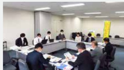
志摩市との打ち合わせ写真