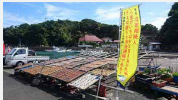
町の各所に『のぼり』があり映画を盛り上げていました