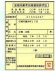
新しい保険証は黄色です

紛失したときや、汚れたときは再交付しますので、保健福祉課医療給付係までお申し出ください。