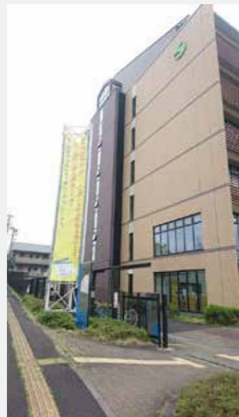
志摩市役所の懸垂幕

映画製作準備委員会では、地元でのオールロケでの撮影を目指して、今後も活動する様子を皆様へお知らせしていきたいと思っています。