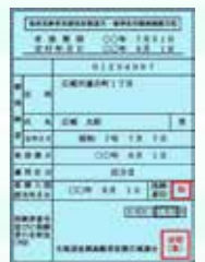
新しい減額認定証・限度証は水色です