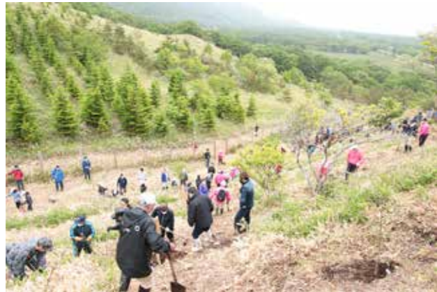
植樹会場奥には約10年前に植樹した木々が大きく成長した姿が見えます