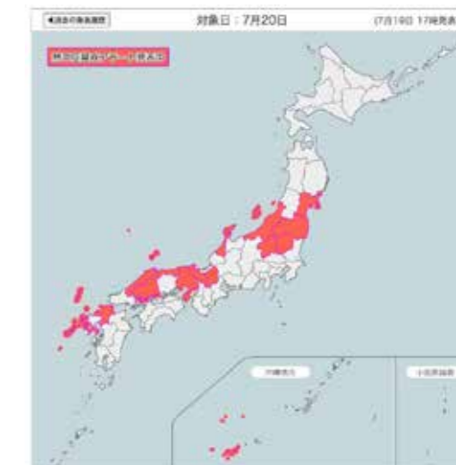
2021年7月19日の熱中症警戒アラート

【熱中症警戒アラート】 URL : https://www.jma.go.jp/bosai/information/heat.html