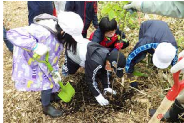
各小学校では記念植樹としてサクラの苗木を児童たちで協力しながら植えました。