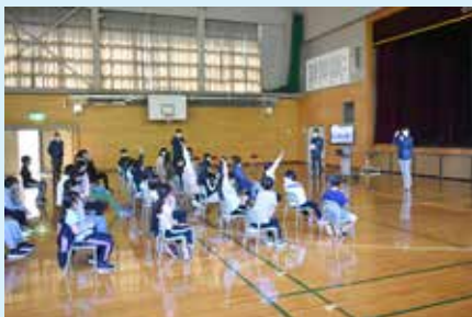
NHK札幌放送局アナウンサーによる講習

9月30日に庶野小学校で、10月6日にえりも小学校で『1日防災学校』が行われました。今年、NHKの防災教室出前講座として、AR浸水アプリを使用した浸水体験やアナウンサーによる講習なども行われました。そのほか、災害食や段ボールベッドなどの災害備蓄品について学んだり、骨折をした場合の処置方法や心臓マッサージの講習、高台への避難訓練などを行い、防災への意識を高めました。