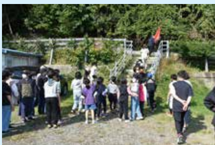
津波警報を想定した避難訓練