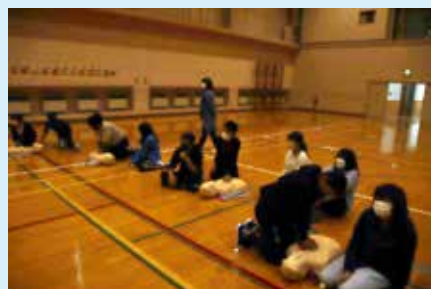
救命救急や応急処置についても学びました