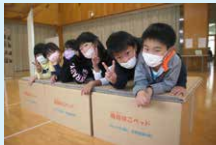
避難所で使われる段ボールベッドの組み立てを習って寝心地を体験