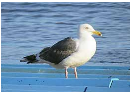
【写真：オオセグロカモメ】

れました。数を減らしている原因は解明されていませんが、天敵のオジロワシの中に、年中道内で生活する個体が増えていることが一つの要因であるといわれています。