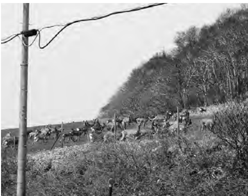
全道的に問題となっているエゾシカによる被害