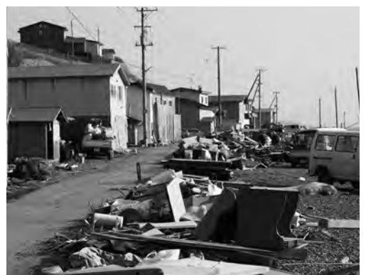
災害で発生したゴミの処理も今後の課題に。

は、普段と災害時に変更はなく、個人と公共施設に分けることもしていない。普段と違うのは、災害時のゴミ搬入は、企画課に被害報告をして、氏名・電話番号・搬入物・搬入量・搬入日を伺った上で、分別方法・搬入先をお知らせして無料で受け入れている。これは、普段のゴミと災害ゴミの判別、それから被害量などの把握のための確認である。