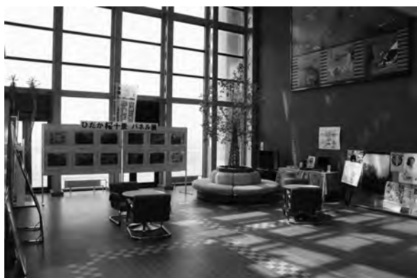
展示品や物品販売など多様な使われ方をしている役場庁舎ロビー

◆質問 役場庁舎ロビーに、観光や案内パンフレットを置くコーナーを作ってはどうか。観光案内員の配置