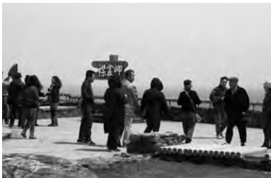
観光客で賑わうゴールデンウィークの襟裳岬(5月3日)