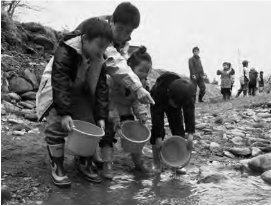
放流したたサケ稚魚を見送る子どもたち

正男代表理事組合長やサケ定置網経営者など約三十人出席しました。神棚に捧げられた稚魚は「元気に帰って来いよ」と声をかけられながら放され、一斉に泳いでいきま