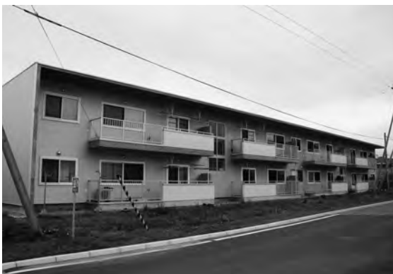
長寿命化計画が作られ、建て替えが進められている公営住宅

戸数が足りないとの指摘については、長寿命化計画全体では将来の人口予測などから、全体の公営住宅必