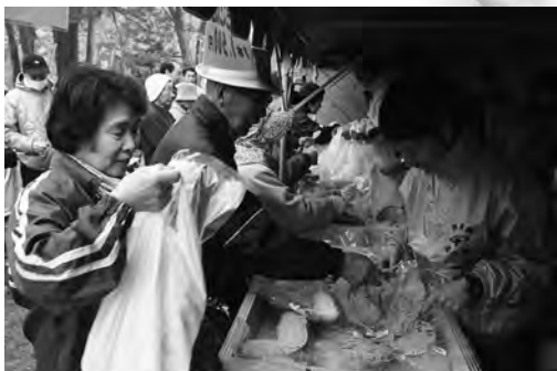
出店数も増えて今年も行列となった直売店

五月十四日、サクラが満開の庶野さくら公園で「海の幸直売会deしよや〜」が開かれ、えりもの特産物とサクラ目当ての観光客で、会場は賑わいをみせていました。