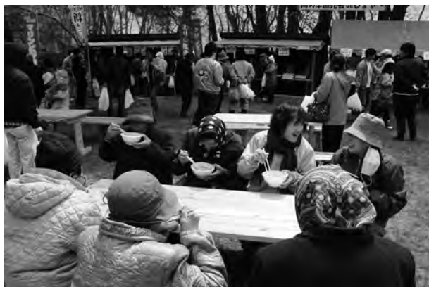
アラ汁を食べながら和やかに談笑する花見客

今年のサクラは、十日前の降雪で開花への影響が心配されましたが、この日にちょうど見頃の時期を迎え、公園の芝生では十組ほどが、家族や友人、仕事仲間と共に花見を楽しんでいました。