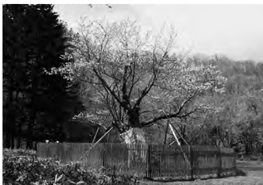
今年も見事な花を咲かせていた樹齢300年を超えると言われている夫婦桜