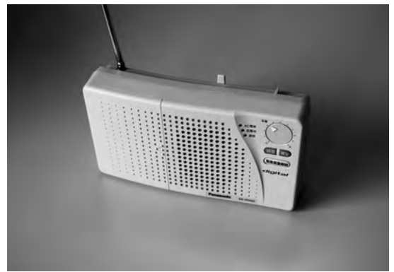
配布に向けて、国や道に補助制度の働きかけをしている戸別受信機

の費用と、それに対する国や道の助成制度、補助制度はあるか。安価な機器で対応するという方法など、全戸設置に向けて検討してほしい。