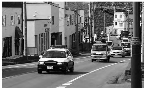
本町市街地を走る一団

春の交通安全運動が始まった五月十一日、町交通安全運動推進委員会による交通安全車両パレードが行われました。 近浦から出発した十五台の車両は、警察のパトカーを先頭に町内を一周。「交通安全運動」と書かれた黄色のステッカーを貼り、事故のない社会を築くために、安全運動を呼びかけました。