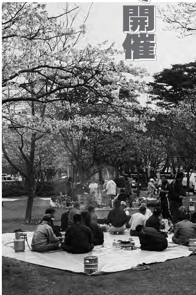
花見を楽しむ姿も数多く見られました。