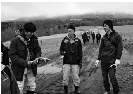
上歌別の町有牧野で拾ったエゾシカの角を手にする参加者。

ほとんどの参加者がシカ角を拾うことができ、成果品を手に満足げな様子でした。また、エ