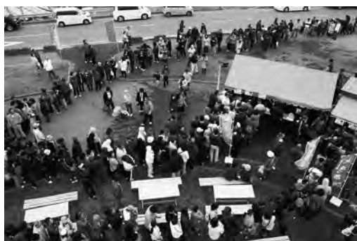
ウニなどの販売所前には、多くの人々が並びました。