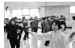
太極拳を学んだ昨年の女性大会