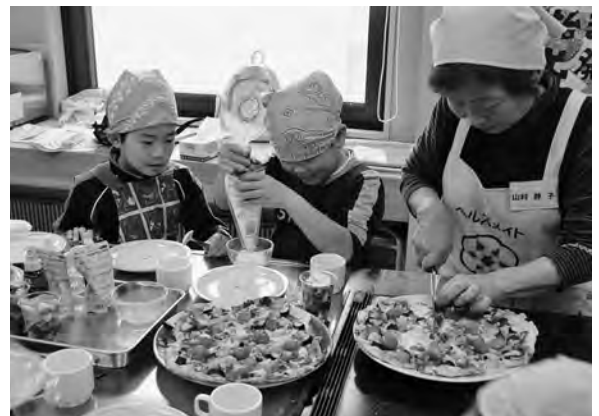
パフェを作る子どもたち

玉や百人一首などの昔の遊びを体験。三年生以上の児童は、コンブ漁をテーマに昔の暮らしを学びました。 お年寄りが、昔は木綿でできた「カスリ」を着て手伝っていたことや、服を乾かすのに着干しをしていたことなどを話すと、子供たちは興味深げに聞いていました。