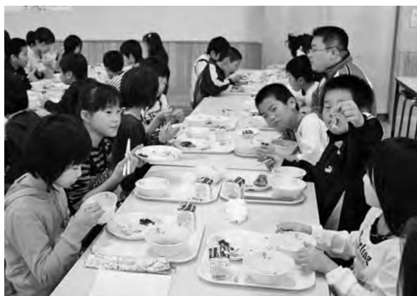
給食を楽しむ小学生

●答弁 委託に関しての予定価格は、ない。民間委託を始めた八年前は、予定価格ではなく、町が直営で行っていた実経費との比較だった。委託を更新した三年前に議員に説明した資料と金額は、予定価格ではなくて八年前に町で採用していた嘱託職員