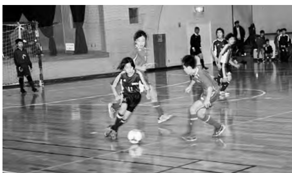
シュートのたびに歓声が飛び交った各試合

交流大会も兼ねたこの大会には、全二十三チームが参加して熱戦を繰り広げました。日高予選は、新ひだか町静内の高静サッカー少年団が優勝しました。