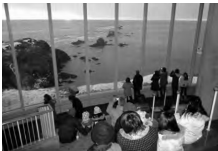
初日の出に合わせて臨時開館した風の館。