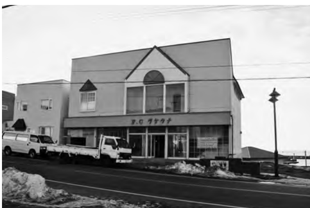
愛称を募集するえりも町交流館

◆質問 条例三条に「管理を他に委託することができる」とあるが、この「管理」は、指定管理者の指定に関する条例にあるような運営や企画など、すべてを含めた管理という意味か。それとも施設の維持管理という意味か。運営費用は補助金ということだが、補助を出すということは委