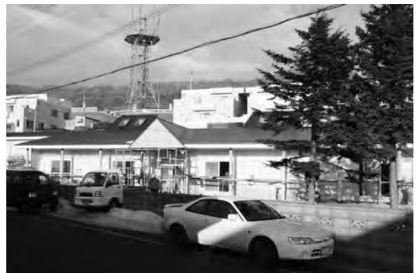
放課後児童クラブとして利用するため改装中の旧老人福祉寮ゆうゆう