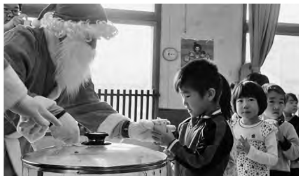
サンタに扮してポップコーンを手渡す風舞の会員