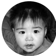
よこはまないと 横濱騎士くん (幸壮・いずみ) H23.2.9生(新浜)