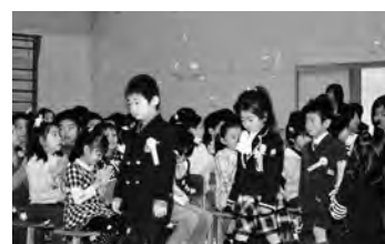
昨年の入学式（えりも小学校）