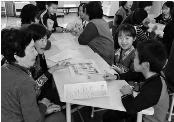
手作りすごろくで遊ぶ児童とお年寄り

また、調理前には、野菜の栄養と働きを、食生活改善推進員からイラスト入りでわかりやすく学びました。