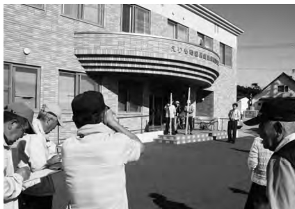
標高調査をする本町老人クラブ

●答弁 七月に本町老人クラブが標高の表示を行ったが、これは北大との相互協力協定に基づき、取り組ん