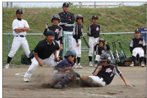
泉野イーグルスと岬野球少年団の攻防