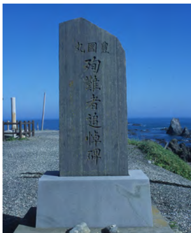
えりも岬の突端にある追悼碑

昭和 4 年（1929）4 月 22 日に、豊国丸（ほうこくまる）が襟裳岬の南東約 16 キ 沖で遭難沈没しました。豊国丸は、サケマス漁などの漁夫や加工職人ら 176 人、船長ら乗組員 33 人を乗せ、カムチャツカ半島東海岸アナツターチャーへ向け、午前 6 時、函館港を出航しました。