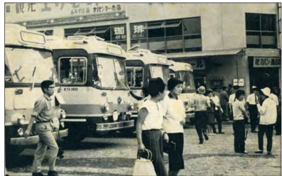
観光バスで埋まるえりも駅（現在の日高信用金庫）

3か年計画で進めていた幌泉小学校校舎改築は9月に鉄骨造体育館が完成して、町民の屋内スポーツへの関心が一気に高まりました。