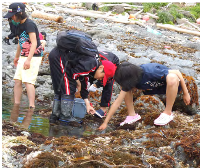
魚やカニを探す子どもたち

小学生の参加者は、磯の潮だまりで、カジカの稚魚やイソガニを見つけ歓声を上げていました。