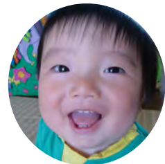
やましたたつき 山科達希くん (晶裕・則子) H24.8.20生(新浜)