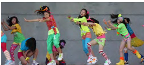
軽快なダンスを披露する子どもたち

6月21日〜23日の3日間、JRバスえりも駅の横にあるえりも漁業協同組合直販店で、大漁祈願大売出しが行われました。