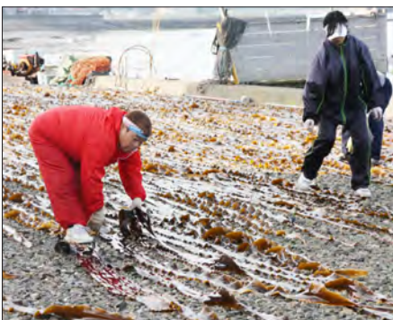
汗をかきながらの昆布干し作業