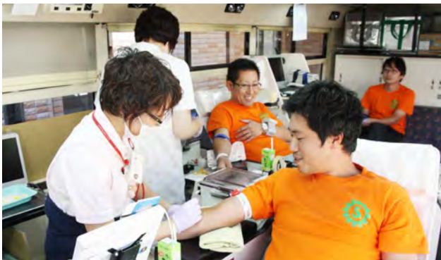
△献血に協力する町商工会青年部の部員