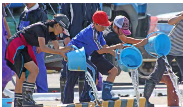
△笛舞漁港でマツカワの稚魚を放流する児童