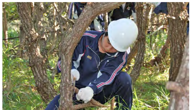
△枝を丁寧にのこぎりで切り落とす生徒

クロマツ林の枝払いは、中高一貫教育推進の柱の一つに掲げる環境教育の一環として、毎年行われています。今年もえりも高校の1年生44名が9月19日にえりも岬国有林内で枝払いの作業を行いました。木の生長を大きく左右する枝払いに生徒は、木の成育状況を1本ずつ確認しながら、丁寧にノコギリを使って枝を落としていきました。