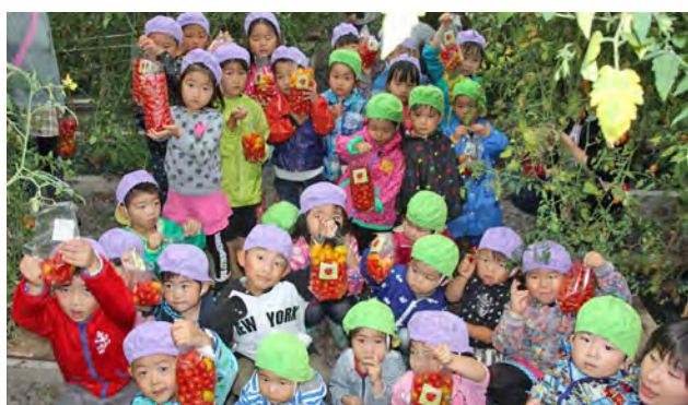
△袋いっぱいミニトマトをつめて喜ぶ園児