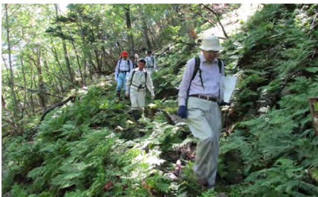
文化庁より猿留山道が国指定文化財に値すると評価

いずれにしても、これら児童生徒への取組を柱に、「いじめは、いつでもどこでも起こり得ること」と捉え、未然防止ときめ細かな指導、対応を通して、「いじめゼロ」を目指してまいります。