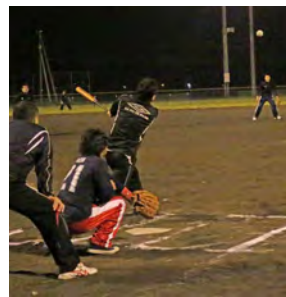
△ヒットを放つ選手