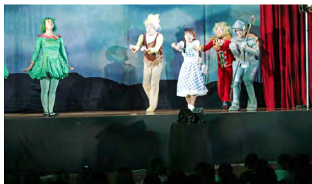
△ミュージカルを熱心に鑑賞する児童

教育委員会では、小学生を対象に北海道教育委員会の協力を得ながら、毎年本格的な舞台芸術の鑑賞を行っています。9月5日、町民体育館に集まった小学生や町民など約350人は、劇団ポプラによるミュージカル「オズの魔法使い」を鑑賞しました。役者のダンスや動く大きなセットの迫力に児童の歓声が、体育館に響き渡りました。