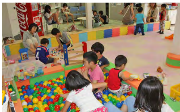
遊び場スペースを中央に配置したひなた1階の様子