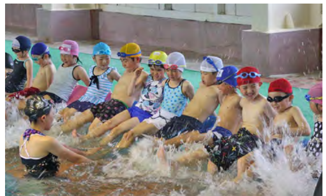
毎年、保護者の関心が高く好評の水泳教室