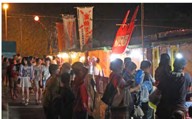
青年団体や町内企業が出店し、まつりを盛り上げる

そこで、当町では、地域の実態を踏まえて教職員が児童生徒への支援を行い、これまでも個別に取組は見