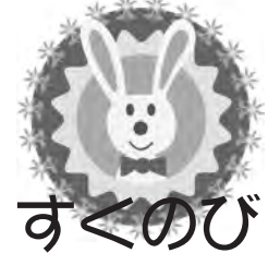
すくのび 「すくのび」は、「す くすくのびのび育っ て」の願いを込めた タイトルです。