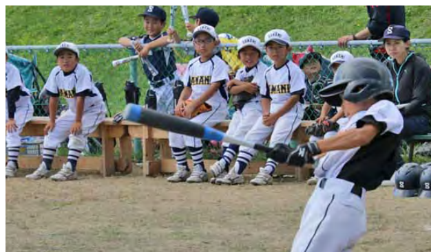
△見事なバッティングを見せる新栄少年団の選手

大会には、日高東部3町と広尾町から8チームが参加しました。当町から新栄とえりも岬野球少年団が出場し、両チームとも手に汗握る攻防を繰り広げていました。結果は、えりも岬が初戦、新栄は2回戦で惜しくも敗れました。