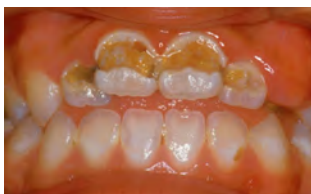
【写真】えりもむし歯

その後、にしかわ歯科医院長の協力も受け、年に2回の歯科健診や歯科指導、フッ素塗布事業を継続しています。平成25年からは、保育所や小学校でフッ化物洗口が開始され、むし歯のあるお子さんは減少しました(図1)。しかし、その一方で、「口腔崩壊」と言われるひとりで10本以上のむし歯を持つているお子さんは、各学年に約1割程度いることから、格差が大きくなっています。