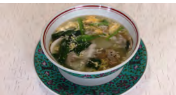
日高昆布XO醤の具 たくさんワントンスープ