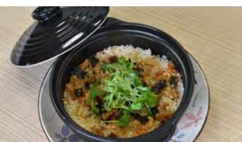
日高昆布XO醤の宝ご飯

えりも高で、えりも漁協女性部連絡協議会が生徒に料理を教える「浜の母さん料理教室」の定番メニュー「えりもお宝炊込みご飯」も、漁協女性部員が脇屋さんから教わったレシピがもたっています。