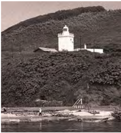
灯台山にあった1966年当時の幌泉灯台(上)灯台としての役目を終え、造成された土地に移築された幌泉灯台記念塔(左)公園は「灯台公園」と名付けられた

この結果、建造物の登録有形文化財として道内は計150件、そのうち日高管内は4件目となります。同記念塔は、えりも港に面する灯台山の頂上に昭和3年に幌泉灯台として建築され、昭和53年に灯台山を切り崩し、現在の場所に移築されました。四角柱の外観で、入り口には半円アーチを付しており、装飾は鉄筋コンクリート造灯台の初期の形式を残し、造形の模範になっています。記念塔が建つ灯台公園は「えりもの灯台まつり」などのイベント会場に使われ、町民や観光客に親しまれています。