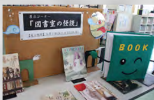
図書室マスコットキャラクター BOOK(ブック)くん