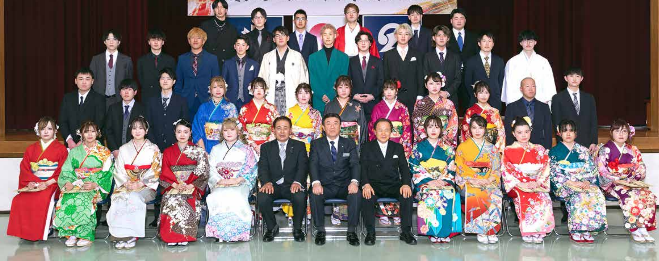
令和5年えりも町二十歳を祝う式典（福祉センター）