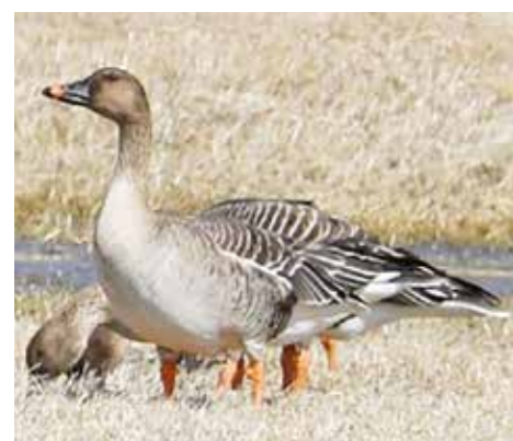
【写真：オオヒシクイ】

シが長いのが特徴です。湖沼や湿地帯に生息し、マガンと一緒に行動することもあります。オオヒシクイは湖沼や湿地で採餌することが多い傾向にあります。マガンとオオヒシクイは、冬になるとロシアのカムチャッカやシベリアから、本州の越冬地へ渡ります。近年では、道内でも越冬し、えりも町の近くでは、新ひだか町や平取町で越冬の記録があります。えりも町では、本州の越冬地へ渡る際などに、襟裳岬や百人浜、大和の採草地や放牧地などで採餌している姿が見られることがあります。