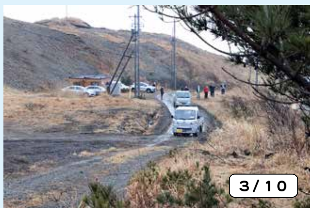
高台へ避難する車両