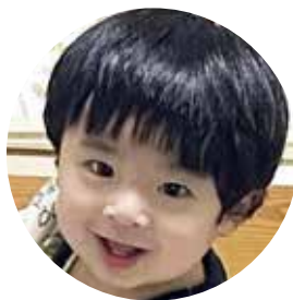
こう こうりゅう 虎生さん 大和・R4.4.1 生