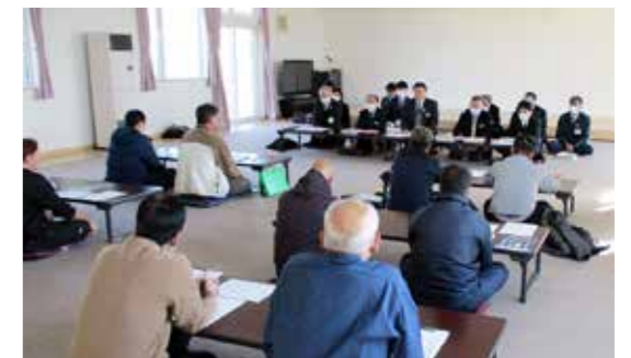
これまで、昨年6月の自治会長会議の場や、2月7日～9日に開催した地区別町政懇談会で説明を行ってきました。