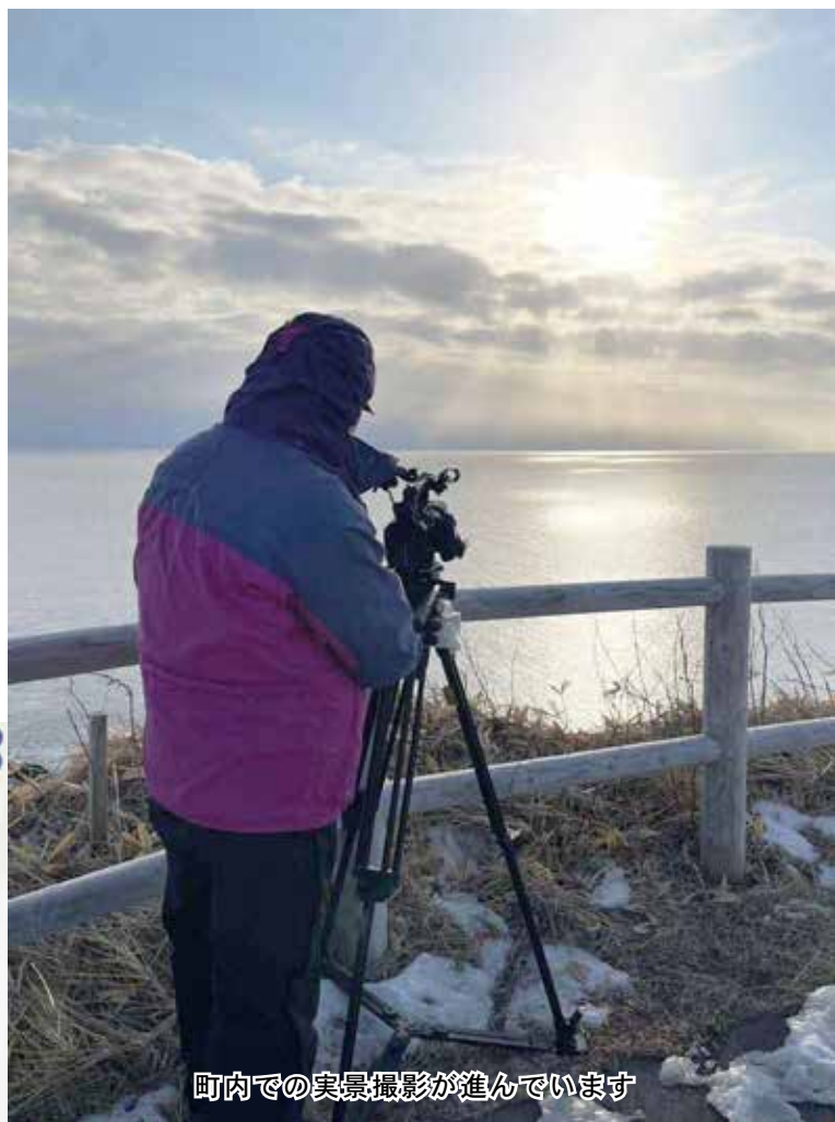
町内での実景撮影が進んでいます