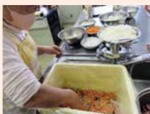
サケ飯寿司の仕込み