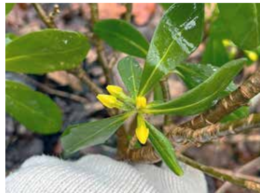
明るい黄色のナニワズのつぼみ