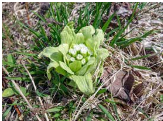
アキタブキの花であるフキノトウ

日は伸びても、寒い日はまだまだ続きます。晴れた日には温かい服装で、春の足音を探しに出かけてみてください。