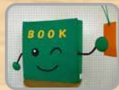
図書室マスコットキャラクター BOOK（ブック）くん