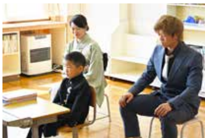
笛舞小学校 (4 / 9)