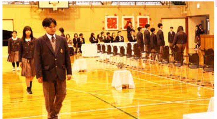
えりも中学校 (4 / 9)