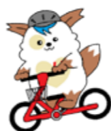
北海道警察シンボル マスコットほくとくん