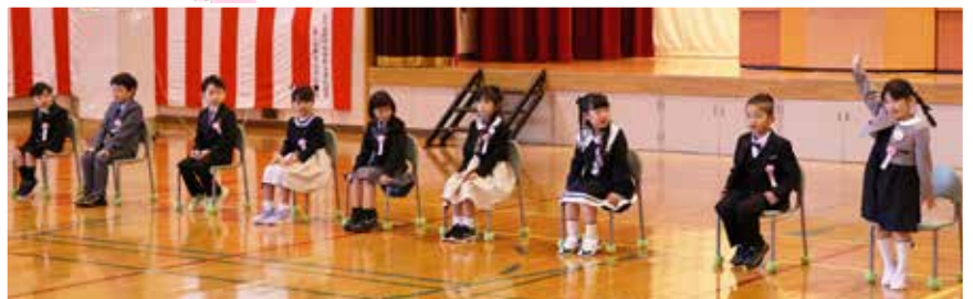
えりも小学校 (4 / 9)