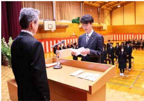
えりも高校 (4 / 8)