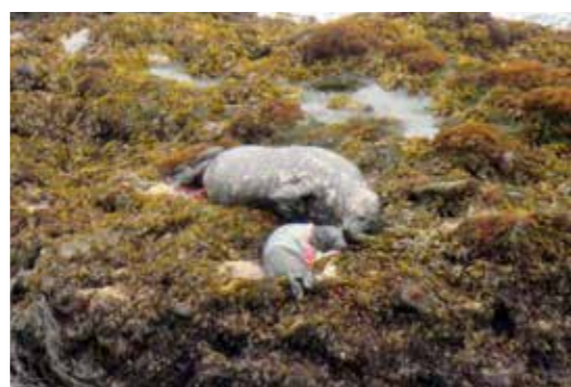
ゼニガタアザラシの出産