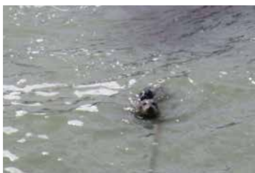
子を背中に乗せて泳ぐ母アザラシ

ゼニガタアザラシはえりも町で一年を通じて観察できる定住性のアザラシです。襟裳岬は分布の南限にあたり、国内最大の繁殖地として知られています。4月下旬から6月上旬は、ゼニガタアザラシの出産・子育ての時期です。例年ゴールデンウィーク前後で出産し、メスがつきつきり子育てを行います。親子は岩礁上や水中でも常に一緒に行動します。ゼニガタアザラシの赤ちゃんは生まれてすぐに泳ぐことができますが、まだ泳ぎが下手な赤ちゃんのために、お母さんが背中に乗せて泳ぐ姿が見られます。親子で鼻と鼻を突き合わせる行動も度々見られますが、これはお互いの匂いを嗅ぎ、親子であることを確認する行動です。 アザラシの授乳期間はとても短く、3週間ほどで離乳します。自分で餌をとるようにになると、親と分かれて行動します。アザラシの子ども時代は非常に短いです。この時期にしか見られない、ゼニガタアザラシの親子に注目して観察してみてください。