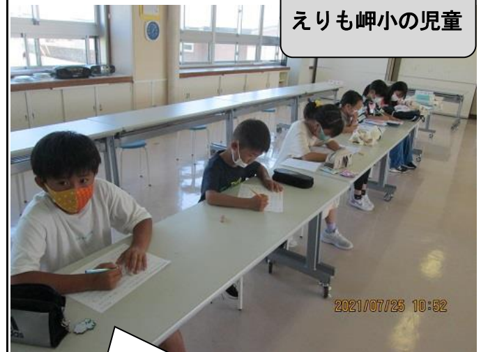
えりも岬小の児童